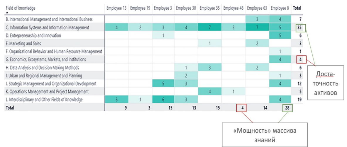
Рис. 1 «Мощность» массива знаний преподавателя кафедры

карте знаний при помощи цветовой градации отображается «мощность» имеющегося у преподавателя массива знаний в различных разделах, на которых специализируется кафедра.