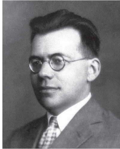
Д. И. Чижевский

Подобное представление об иерар- хичности человека Д. И. Чижевский излагает в двух работах: «Досто- евский и западноевропейская фи- лософия» (1931) и «Достоевский- психолог» (1932). В перечисленных статьях мыслитель указывает источ- ники «традиционного иерархиче- ского учения о душевной жизни»: это святоотеческая антропология, неоплатонизм (Достоевский его воспринимает через Шиллера), романтизм Гофмана и Каруса. Чи- жевский утверждает, что человек