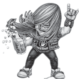
Рис. 3. Образ типичного металлиста

Если поклонники металлической музыки вначале воспринимались как представители маргинальной субкультуры, то в период коммерциализации индустрия начинает массово производить для них не только диски групп, но и другую сопутствующую продукцию. Уже к середине 80-х годов формируется как образ хэви-метал музыканта, так и его поклонника: длинные волосы, чёрная кожаная косуха или джинсовая куртка (зачастую с нашивкой на спине, шевронами и шипами, которые ввели в обиход Judas Priest), футболка с принтом любимой группы, высокие кроссовки или сапоги-казаки (в зависимости от жанра), значки, цепи и браслеты.