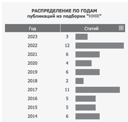
Рис. 6. Распределение по годам научных публикаций, проиндексированных в РИНЦ по запросам «metal music», «heavy metal», «металлическая музыка», «тяжёлый рок»

– тяжёлая металлическая музыка с момента её появления стала объектом научных исследований, в которых она рассматривалась как один из факторов научной проблематики. Как правило, до середины 2000-х годов она не была полноценным объектом научных исследований;