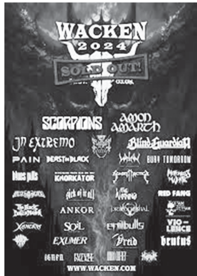
Рис. 2. Афиша фестиваля Wacken Open Air, 2024 г.

Развитие самого направления прошло в обществе путь от андеграунда и неприятия (связанного с протестом молодежи в 70-е годы) до полнейшей коммерциализации с сопутствующими этому чартами, именитыми звукозаписывающими компаниями, раскрученными гастрольными турами, атрибутикой и массовыми фестивалями, например: Wacken Open Air (Германия), год основания 1990 (рис. 2), Download Festival (Великобритания), год основания 2003, Hellfest (Франция), год основания 2006, Rock in Rio (Бразилия), год основания 1985, Tuska Open Air (Финляндия), год основания 1998, Нашествие (Россия), год основания 1999. Эти фестивали собирают