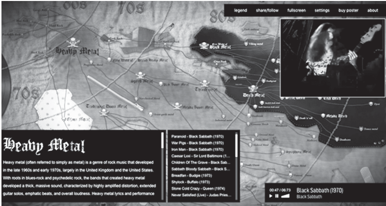
Рис. 1. Интерактивная карта Map of Metal ( https://mapofmetal.com )

Развитие самого направления прошло в обществе путь от андеграунда и неприятия (связанного с протестом молодежи в 70-е годы) до полнейшей коммерциализации с сопутствующими этому чартами, именитыми звукозаписывающими компаниями, раскрученными гастрольными турами, атрибутикой и массовыми фестивалями, например: Wacken Open Air (Германия), год основания 1990 (рис. 2), Download Festival (Великобритания), год основания 2003, Hellfest (Франция), год основания 2006, Rock in Rio (Бразилия), год основания 1985, Tuska Open Air (Финляндия), год основания 1998, Нашествие (Россия), год основания 1999. Эти фестивали собирают