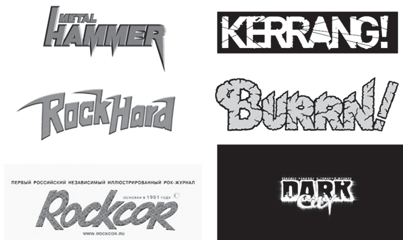
Рис. 4. Логотипы тематических журналов, посвящённых тяжёлой металлической музыке

В России к таким культовым журналам можно отнести ROCKCOR/ПОККОР, год основания 1991 ( https://www.rockcor.ru ) и Dark City/Дарк Сити, год основания 2000 ( http://dark-city.ru ). В журналах печатаются новости из мира металлической музыки, анонсы альбомов, обзоры и критика новинок индустрии, интервью с музыкантами и многое другое. С развитием сети Интернет у металлических групп появляются собственные сайты, а в эпоху Web 2.0 активность групп и музыкантов перемещается в социальные сети.