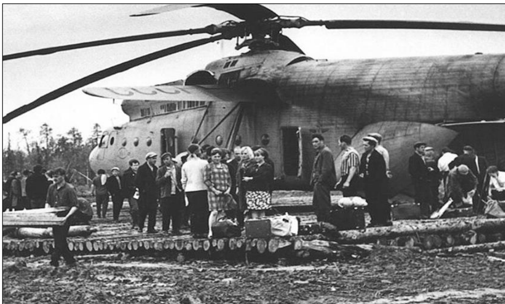
Рис. Ми-6 привез очередную партию новоселов и стройматериалов [5]

В течение своего долгого существования Вуктыл предоставил стране впечатляющие объемы природного газа и конденсата. Общий объем поставок превысил 400 млрд куб. метров газа и более 55 млн тонн конденсата. Однако разработка месторождения велась с приоритетом на истощение ресурсов, и поэтому неизбежны были и значительные потери конденсата. Более 100 млн тонн до сих пор просто остаются в пласте недоступными для извлечения. В настоящее время Вуктыльское месторождение характеризуется высоким процентом добычи газа – около 85 %, что объясняется его уменьшающимся пластовым давлением. Однако по магистрали «Сияние Севера» до сих пор продолжает идти газ.