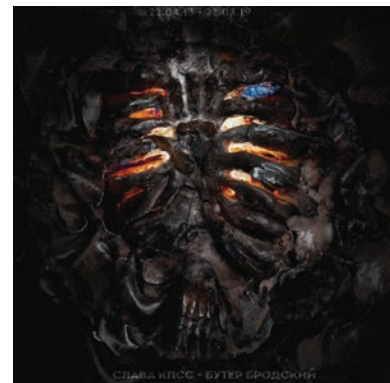
2. Обложка альбома Славы КПСС «Бутер Бродский». 2019