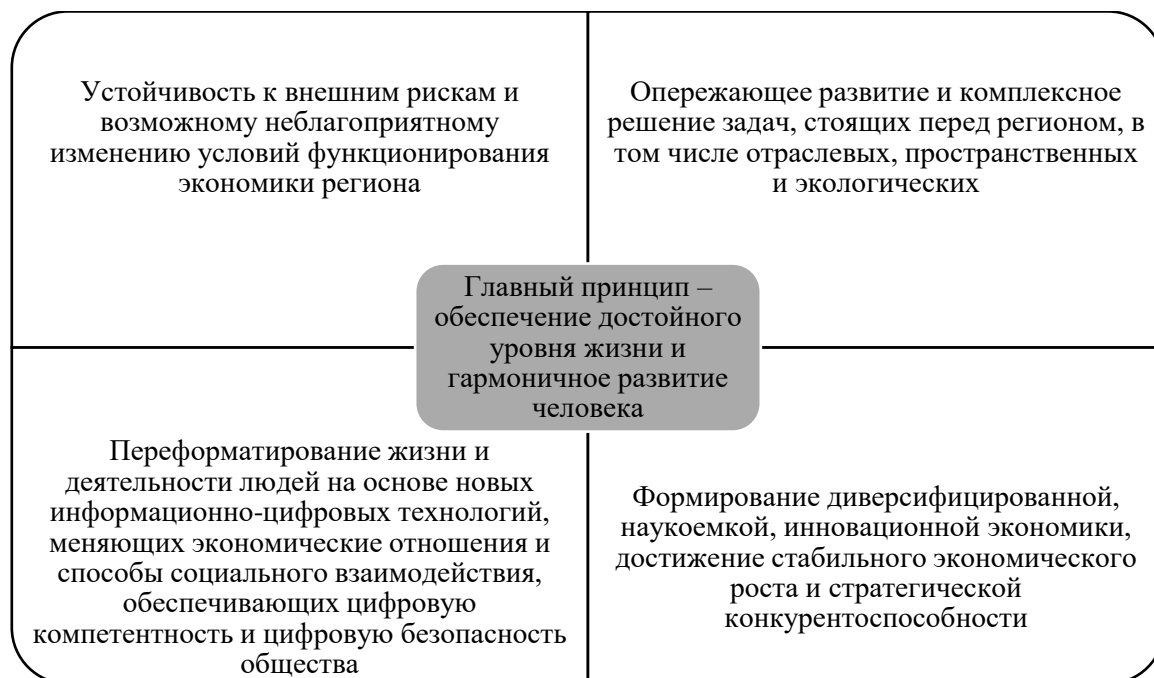
Рис. 1. Принципы Стратегии социально-экономического развития Республики Дагестан на период до 2030 г. (составлено автором по [14])

Стратегия социально-экономического развития Республики Дагестан на период до 2030 г. [14], разработанная в соответствии со стратегическими приоритетами страны, представляет собой базовый документ, характеризующий переход региона к качественно новому этапу развития. Система принципов формирования данной Стратегии представлена на рис. 1.