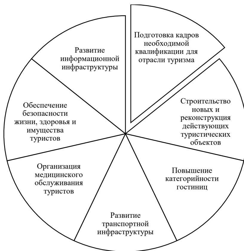
Рис. 2. Направления совершенствования туристской инфраструктуры в Республике Дагестан (составлено автором)

В своем исследовании П.Г. Абдулманапов подчеркивает: «...чтобы выправить квалификационный дисбаланс на региональном рынке труда, необходимо создавать систему управления квалификацией кадров на всех уровнях – от предприятия до региона» [2, с. 120].