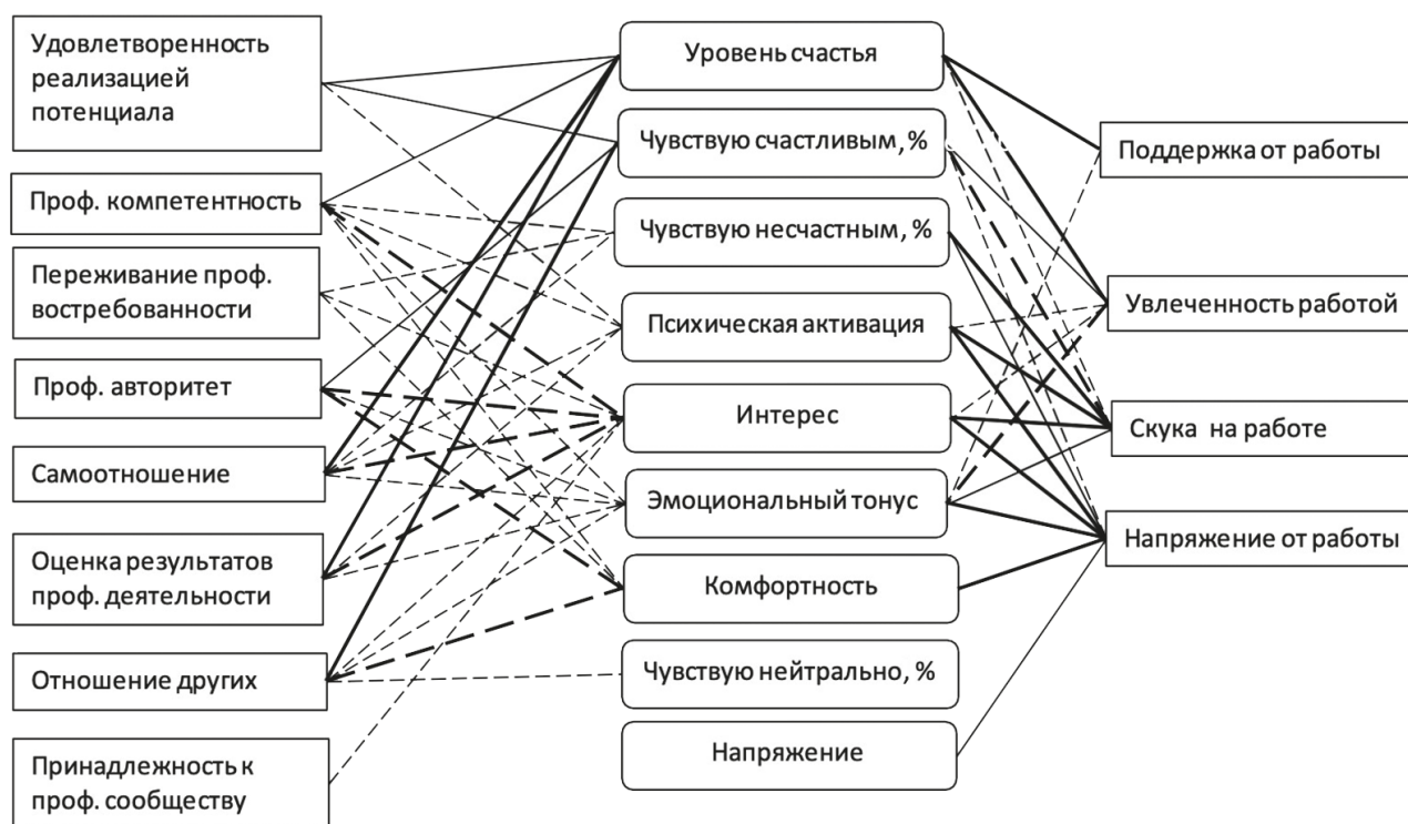
Рис. 1. Взаимосвязь показателей профессионального благополучия и эмоциональных характеристик психологического благополучия

С помощью корреляционного анализа выявлено, что взаимосвязи показателей профессионального благополучия с эмоциональными характеристиками психологического благополучия высоко интегрированы. Полученные значимые корреляции представлены на рис. 1.