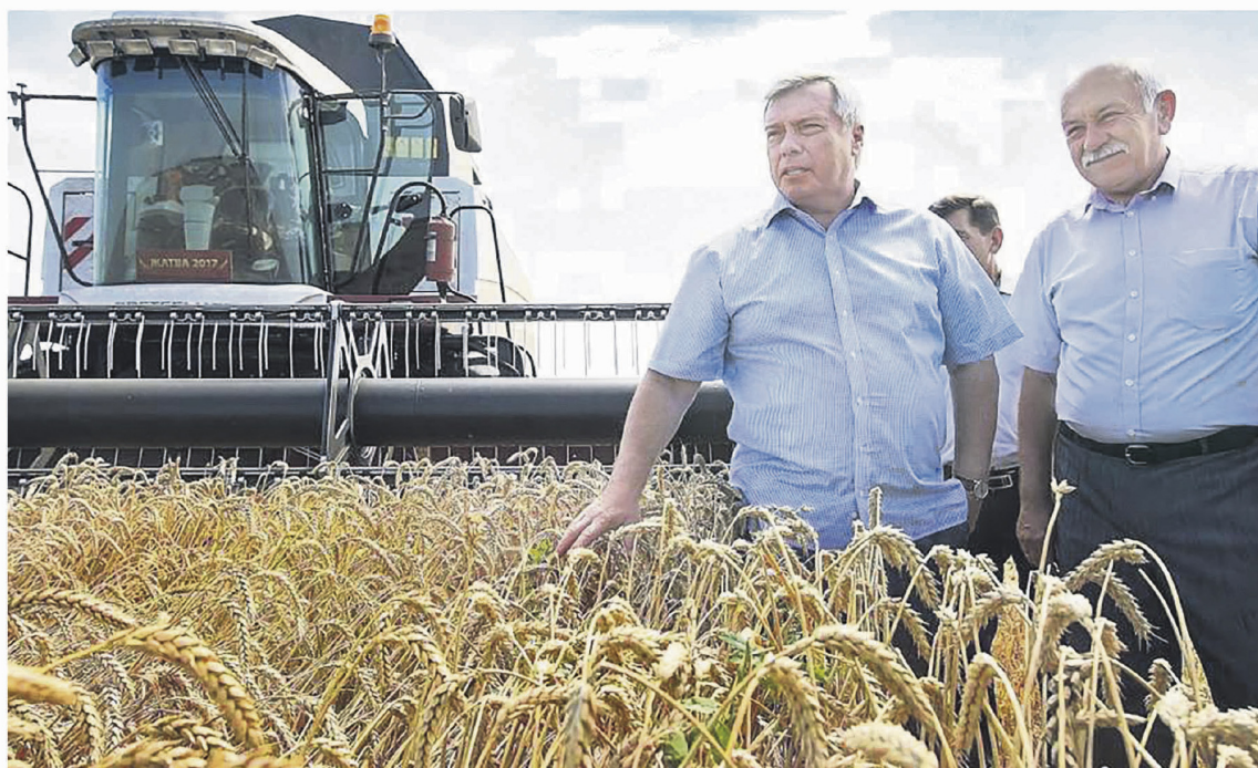
Донской хлеб в этом году будут убирать с особой заботой

Отметим, что осенняя посевная кампания проходила в благоприятных условиях. В почве было достаточно влаги, были проведены все необходимые ра-