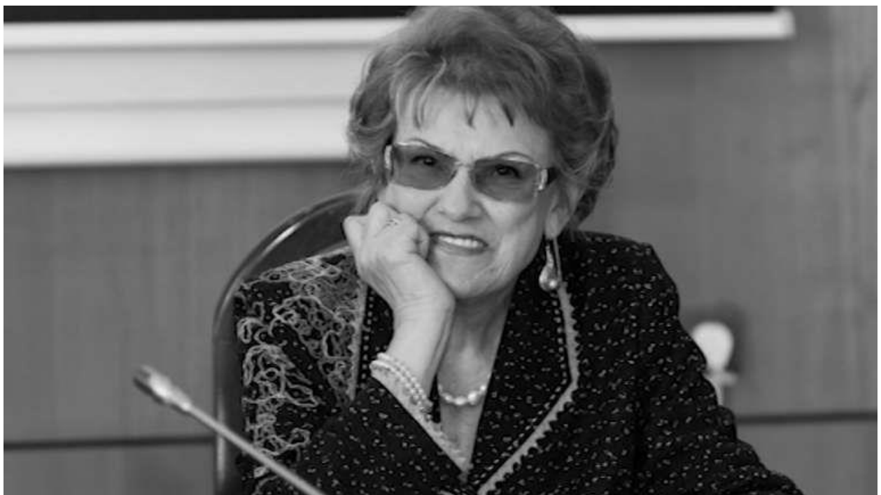
Людмила Алексеевна Вербицкая (1936-2019)