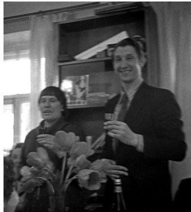
Рис. 22. Празднование юбилея лаборатории онтогенеза. 1980 г.