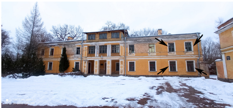
Рис. 2. Петергоф, усадьба Сергиевка, Гофмейстерский корпус (Корпус Б по современной номенклатуре). Вид с западной стороны. Фото апрель 2023 г.