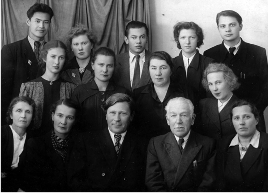
Рис 1. Преподаватели, сотрудники и аспиранты кафедры эмбриологии ЛГУ.