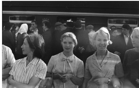
Рис. 8а, б. Отъезд эмбриологического отряда на Белое море.

Московский вокзал г. Ленинграда, 1967 г.