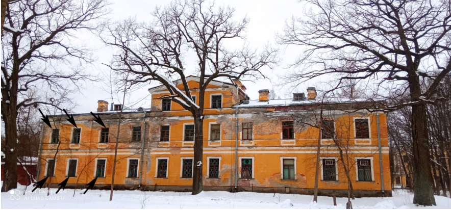
Рис. 3. Петергоф, усадьба Сергиевка, Гофмейстерский корпус (корпус Б по современной номенклатуре). Вид с восточной стороны. Фото апрель 2023 г.