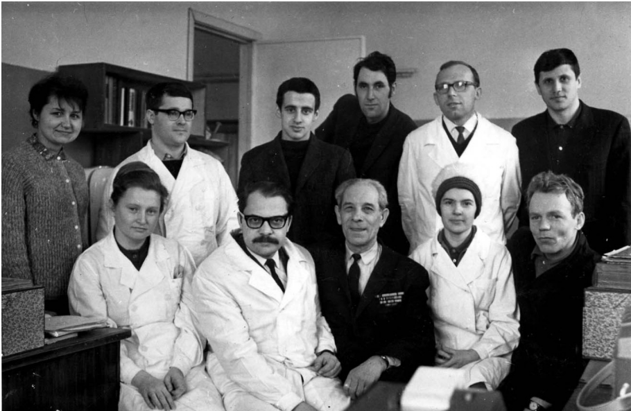
Рис. 4. Сотрудники и студенты лаборатории экспериментальной цитологии, в помещениях дворца Лейхтенбергских. Петергоф, усадьба Сергиевка. 1970 г. Слева направо.

БиНИИ и коллектив лаборатории морфологии клетки института цитологии были, по сути, единым научным сообществом (рис. 4).