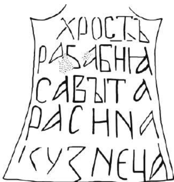
Рис. 3. Прорись надписи на кресте из д. Войносолово

Надписи и изображения: крест относится к группе больших крестов «ижорского» типа с изображением почти на всей лицевой плоскости большого же рельефного креста с трехлопастными завершениями, повторяющими форму самого креста (рис. 3). По краям основного креста и креста в средокрестии вырезаны ободки. Надписи — монограммы на боковых и верхней лопастях ис — црь сла — нечеткие, как-будто процарапаны. Подпись Ильи Онцифорова находится на нижней лопасти рельефного креста, на расширении, вырезана более тщательно, в две строки, без разделения на слова, строки идут вверх в направлении слева направо (рис. 4).