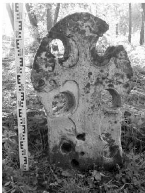
Рис. 4. Крест с надписью из д. Ястребино

Палеография: и с косой перекладиной в верхней части буквы, ь с маленьким кузовом, ц с коротким хвостом с изломом, лигатура н+ц , ѡ с перекладиной в нижней части овала, в с высокой квадратной петлей, вытянутость всех букв позволяют датировать надпись не ранее XV вв. и позже.