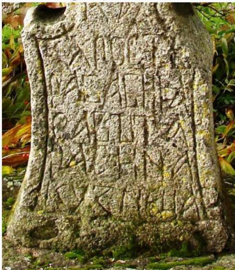
Рис. 2 Надпись на кресте из д. Войносолово (Здесь и далее фото и рис. В.Б. Панченко)

под крестом ка под титлом. По краю креста идет обрамляющий прорезной ободок. Все пространство нижней лопасти — основания занимает текст (рис. 2):