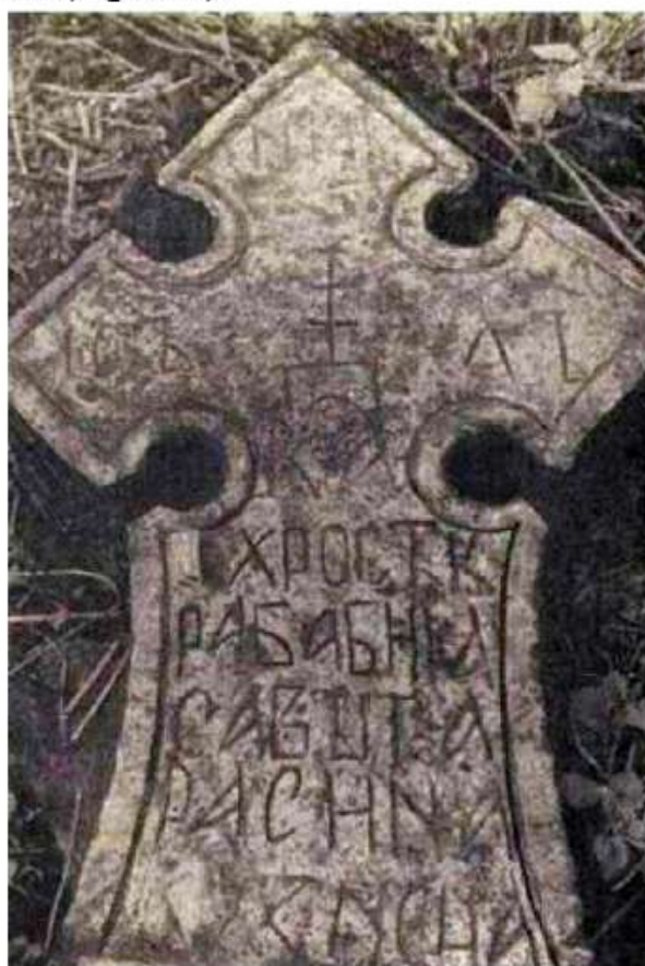
Рис.1. Крест из д. Войносолово Публикуется по: Sedov 1962: 312, рис. 2

Подписной каменный крест из д. Войносолово Кингисеппского района Ленинградской обл. в настоящее время находится у Екатерининского собора г. Кингисеппа. Впервые он был опубликован в 1962 г. В. В. Седовым, который датировал его XIV в. Крест относится к «ижорскому» типу, вставлен в плиту («подпятный камень») (рис.1).