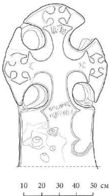
Рис. 5. Прорись креста с надписью из д. Ястребино