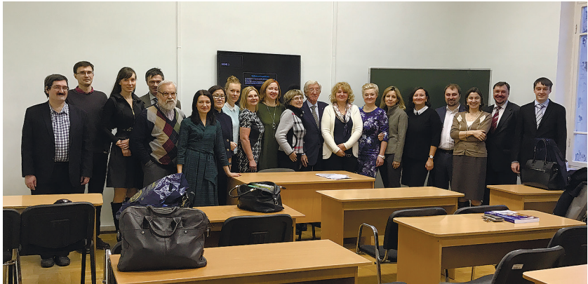
Кафедра мировой политики (2010-е гг.)