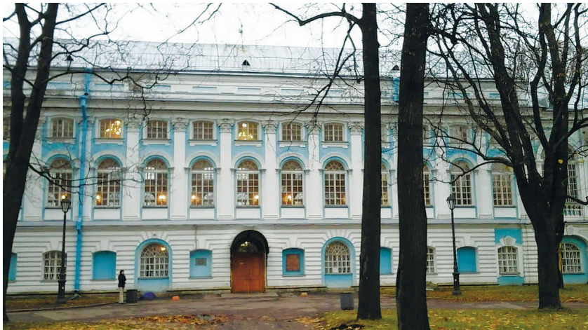
Факультет международных отношений СПбГУ