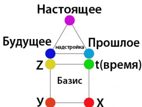
Рисунок 1. Совокупность элементов исторического материализма

Рассмотренный перечень программ позволяет их систематизировать и зафиксировать посредством понятий исторического материализма в виде конструкции «базиса» ( греч. Basis – основание ). Как известно «базис» согласно формулировке Карла Маркса (нем. Karl Heinrich Marx; 1818 – 1883 ), основателя «марксизма», представляет из себя совокупность исторически определённых производственных отношений (рисунок 1).