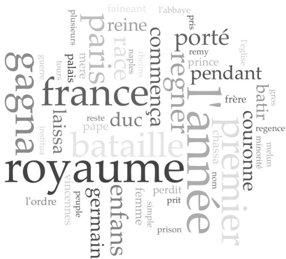
Илл. 3. Частота употребления слов в Новой исторической и хронологической игре.

Более того, можно задаться вопросом относительно критериев отбора деяний королей. Так, примечательно, что у Людовика VII не были указаны крестовые походы, в которых тот принимал участие. При этом в Хронологической и исторической таблице эта информация содержалась. Также вызывает удивление, что в обоих играх отсутствовало упоминание о строительстве Версаля Людовиком XIV. На наш взгляд, данный факт важен, поскольку это позволило поставить дворянство под контроль государства, т.е. фактически послужило важным этапом становления Франции как административной монархии. При этом у ряда других государей было упомянуто строительство менее значимых сооружений, как Люксембургский дворец при регентстве Марии Медичи. Отдельно вызывает удивление, что у Людовика XV было перечислено намного больше побед, чем у его предшественников, хотя данного монарха сложно назвать выдающимся полководцем. Наше предположение состоит в том, что на это повлияло первое издание игры, сделанное при Людовике XV. Примечательно, что борьба с парламентской оппозицией, которая имела место в годы его правления, никак не была отражена в источнике. Вероятно, этот факт скорее дискредитировал образ монархии, нежели способствовал ее пропаганде. Данный аспект