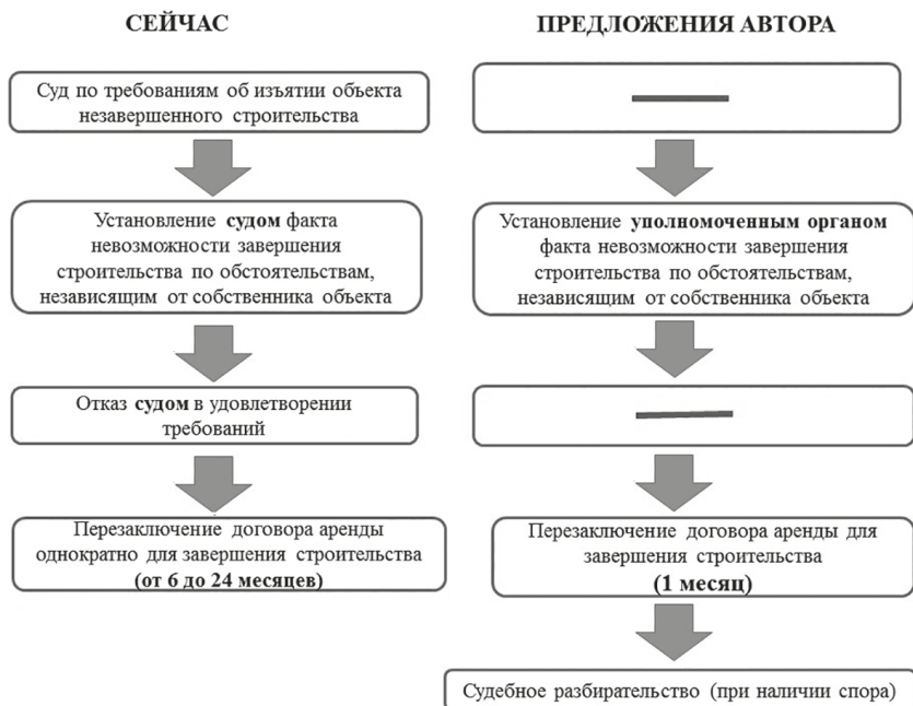
Рисунок. Процедура перезаключения договора аренды земельного участка при наличии вины уполномоченных органов в просрочке строительства ОНС

бирательства в суде строительство будет заморожено на срок от одного года до двух лет, а уполномоченный орган не сможет сдать в аренду земельный участок повторно и получать доход. Кроме того, необходимо учесть и повышенную нагрузку на судебную систему.