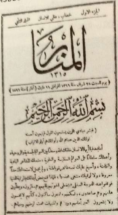
Обложка второго выпуска журнала «Маяк»

Шейх трех тарикатов (Накшбандийа, Кадирийа, Шазилийа) и известный богослов Сайфулла-кади Башларов (1853–1919) был сыном лакского оружейника из сел. Ницовкра. В 1878 году он был выслан из родного Дагестана в Саратовскую губернию. В Поволжье он обучался у сторонника «нового метода» Зайнуллы Расулева (1833–1917) и преподавал в новометодной школе в Уфе. Однако заимствования у татарских джадидов ограничивались лишь методикой обучения арабскому языку. Взгляды Башларова лежали в русле прежней богословской традиции 4 . Самоизоляция от политической жизни Российской империи после октябрьского Манифеста 1905 г. была характерной