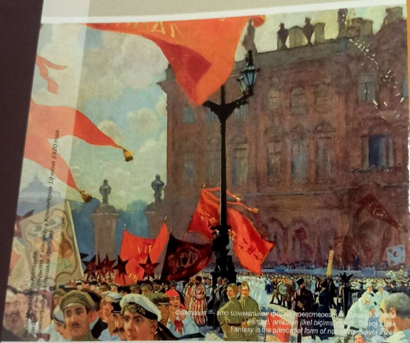
Борис Кустодиев. Президиум в честь открытия II конгресса Коминтерна 19 июля 1920 года.

With the cooperation of: Исследовательским центром имени Ататюрка Atatürk Araştırma Merkezi Atatürk Research Center işbirliği ile