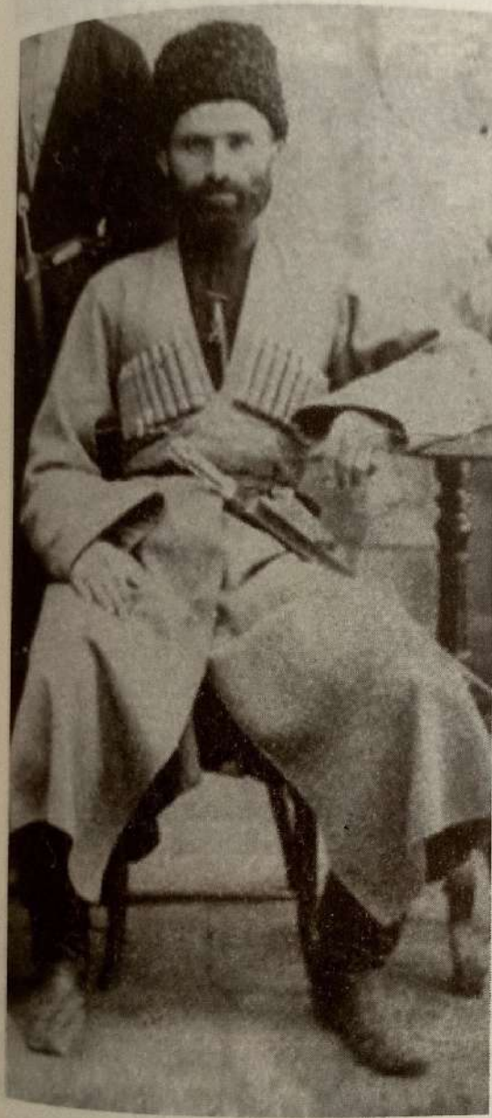
Абусуфьян Акаев (1872–1931)

Вернувшись в Дагестан, Акаев в 1902 г. сам открывает медресе. А с 1904 года начинает издавать в типографии в Темир-хан Шуре книги и учебники на арабском и на кумыкском языках. В Каире он познакомился лично с упомянутым выше Рашидом Рида. А при Советской власти в