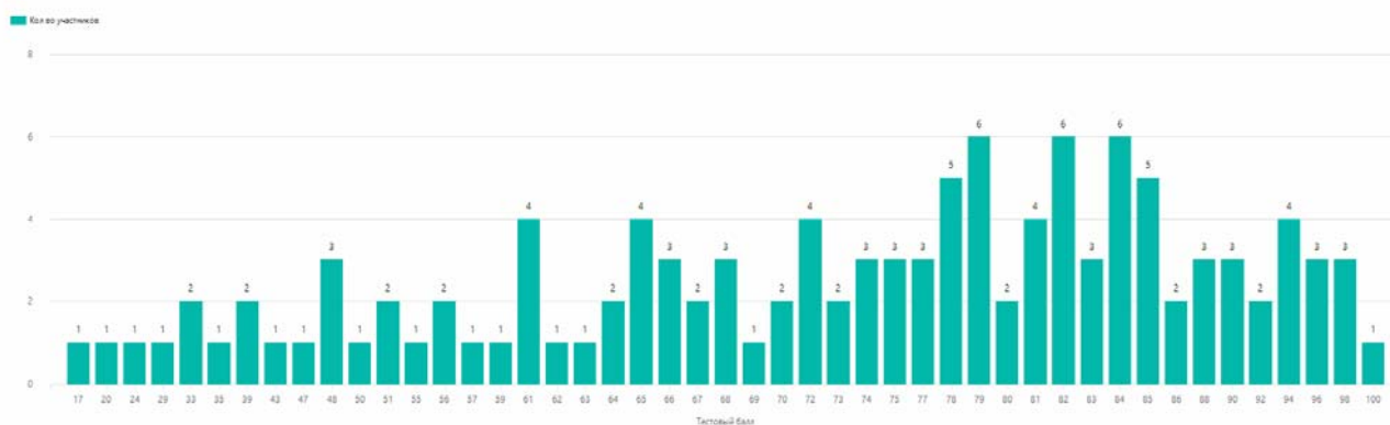
Диаграмма распределения тестовых баллов участников ЕГЭ по предмету в 2023 г.

На диаграмме и в таблице 10 представлено распределение тестовых баллов по французскому языку в 2023 году (количество участников, получивших тот или иной тестовый балл).