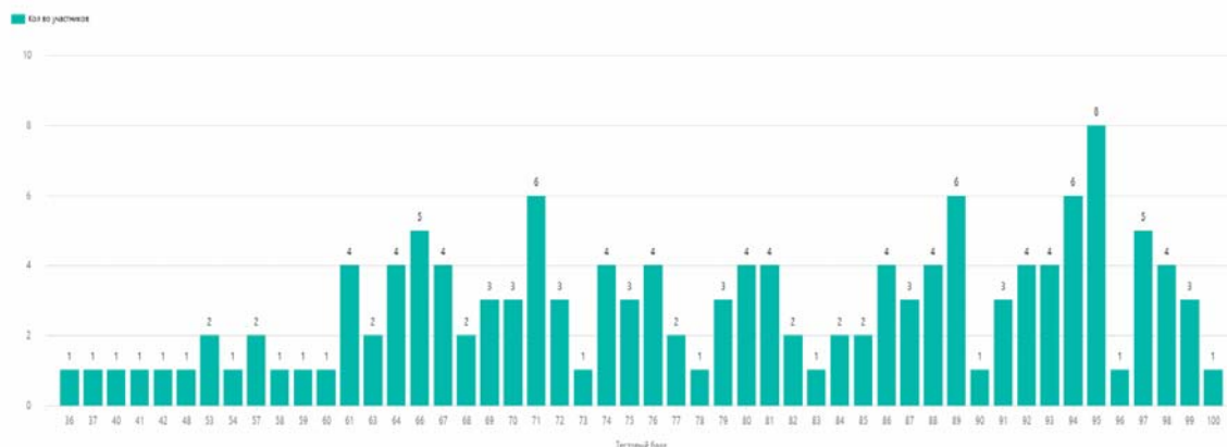
Диаграмма распределения тестовых баллов участников ЕГЭ по предмету в 2022 г.

Пороговый балл по иностранным языкам составляет 22 балла по 100-балльной шкале. Преодоление порогового балла подтверждает освоение выпускником основных общеобразовательных программ среднего (полного) общего образования.