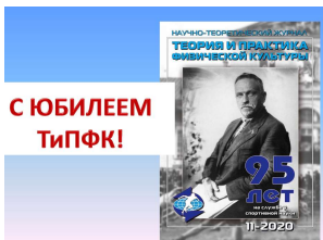
«Theory and Practice of Physical Culture» - новый формат информационного ресурса спортивной науки