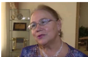
Обсуждение нового российского комплекса «Готов к труду и обороне» на телеканале МИР 24.