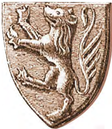
Рис. 1. Герб Русской земли (Галиции). С печати Владислава Опольского. 1378 г.

В литературе вопрос об Австрийской Руси и тем более об истории формирования ее региональной идентичности практически не исследовался. На русском языке существует только одна обширная работа по истории русского движения в Галичине [1], есть еще одна похожая работа на английском, но она посвящена Подкарпатской Руси и охватывает более узкий период [2]. История борьбы народов Габсбургской монархии за независимость также достаточно основательно рассмотрена в старом советском двухтомном издании «Освободительные движения народов Австрийской империи» (М., 1980–1981) [3–4]. Упоминания о русском населении Австрии содержатся в исследованиях по истории русинов, как называют современную восточно-европейскую народность, сформировавшуюся как раз, в том числе (и даже большей частью), на территории Австрийской империи в конце XVIII — XIX в. [5–9]. История национального русского (русинского) движения в Австрии более или менее подробно освещалась в дореволюционных изданиях (см., напр.: [10–12]), отчасти в изданиях по истории Галичины [13–15]. Не так давно вышла в свет интересная монография А.В. Мартынюка, в которой подробно рассматривается история взаимосвязей Австрии и Восточной Европы, в частности политические и культурные связи Австрии с Древней Русью, но, к сожалению, только в период Средневековья (XIII — начало XVI в.) [16]. Существует также много общих работ по истории Австрии, в которых так или иначе затрагивается тема этнических меньшинств [17–23].