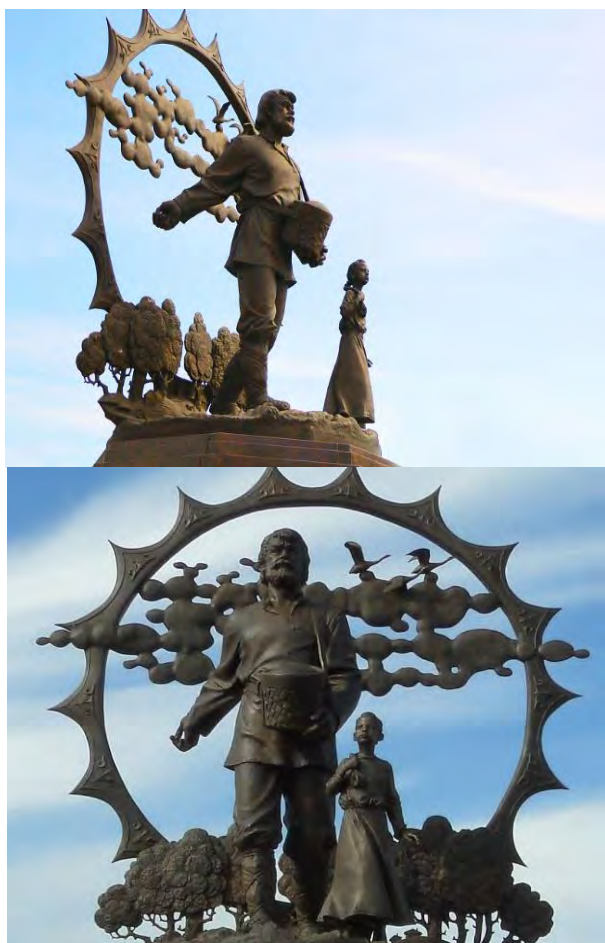
Рисунок 1. Памятник крестьянам-переселенцам на Алтай

ского края как аграрного региона страны. Олег Закоморный — известный скульптор и автор символического монумента.