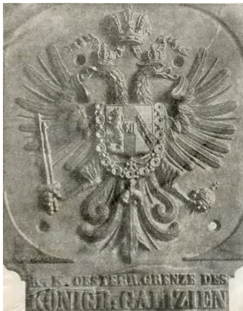
Рис. 2. Герб Королевства Галиции на фоне австрийского имперского герба (двуглавого орла). Русский трофей от Галицийской битвы (1914 г.). Фото из журнала «Нива». 1914. № 47 1

После присоединения Галичины к Австрийской империи положение русинов несколько улучшилось. В 1774 г. императрица Мария Терезия учредила в Вене духовную семинарию, в которой было шесть вакансий для галицких епархий, в 1783 г. Иосиф II учредил такую же семинарию во Львове, а в 1784 г. там же был открыт и университет с богословским факультетом. С 1787 года в университете было введено преподавание на местном русском языке. В течение десяти лет русины заняли в университете все кафедры на богословском факультете и многие светские кафедры. Среди профессоров не было ни одного поляка [9, с. 914].