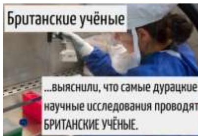
Рис.1. Изображение научного эксперимента как типичная визуальная составляющая мема «Британские учёные».

Вербальная компонента, как правило, сопровождается изображением научного эксперимента (рис. 1) или самих «британских учёных», что, безусловно, усиливает воздействующий потенциал текста (ср.: «без визуального образа в этой области коммуникации [Интернет – прим. Н.П.] автор не существует» [2:85]), а также подчёркивает глубокую иронию, заложенную в реплике.