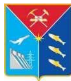
Правительство Магаданской области