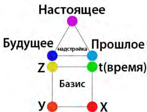
Рисунок 1. Совокупность элементов исторического материализма

Рассмотренный перечень программ позволяет их систематизировать и зафиксировать посредством понятий исторического материализма в виде конструкции «базиса» ( греч. Basis – основание ). Как известно «базис» согласно формулировке Карла Маркса (нем. Karl Heinrich Marx; 1818 – 1883 ), основателя «марксизма», представляет из себя совокупность исторически определённых производственных отношений (рисунок 1).