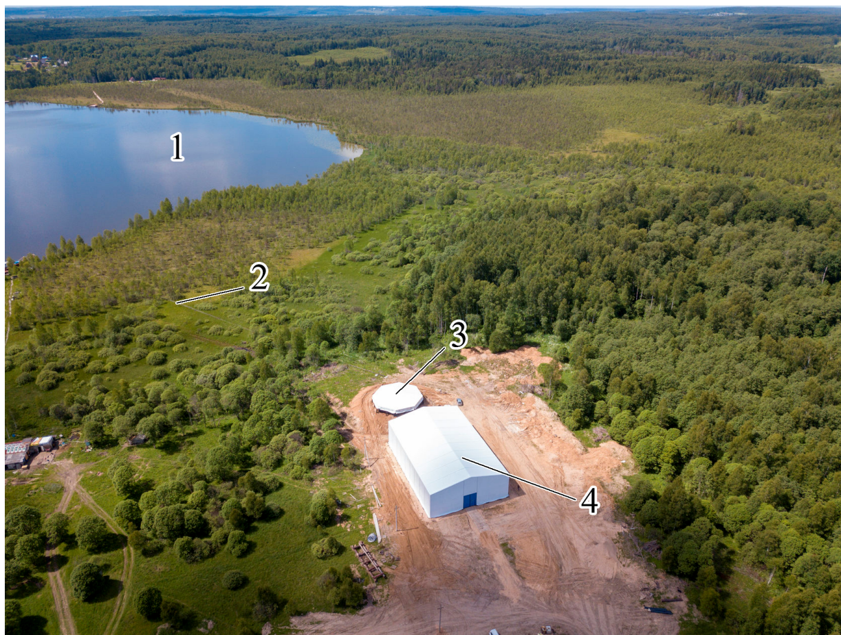
Рис. 2: Общий вид объекта: 1 – озеро Савельево; 2 – магистральный пульпопровод; 3 – приемный бункер-накопитель; 4 – технологический цех производства торфо-сапропелевого удобрения (Тентовый ангар 24 × 36 м).

находиться в определенном диапазоне (40–55%), если не соблюдается такое условие, то на выходе получают бракованную продукцию, или происходит возгорание торфа в кинематическом дезинтеграторе [Дементьев и Штин, 2019; Штин, 2009].