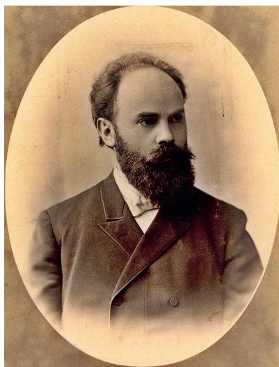
Рис. 2. Леон Рабинович, владелец и редактор «Ха-Мелиц» в 1893–1903 гг.

Финансовое положение издателей «Ха-Мелиц», как и финансовое положение остальных еврейских издателей, на протяжении всего периода публикации было затруднительным вследствие ограниченности собственных средств, высоких затрат на содержание или аренду типографии, распространение выпусков, позже – оплату труда авторов при невысокой стоимости номеров газет, низких доходах еврейской аудитории и ситуации высокой конкуренции за читателей. Из-за экономических проблем многие газеты и журналы закрывались после недолгого периода существования, а другие, в том числе и «Ха-Мелиц», были вынуждены покрывать часть расходов из своего кармана, а также обращаться за финансовой