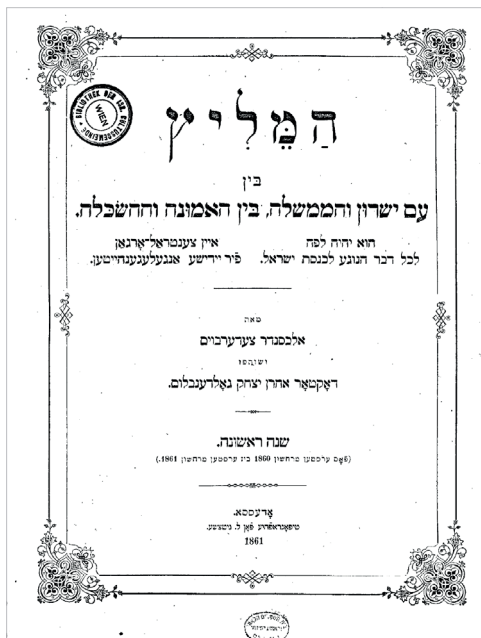
Рис. 3. Обложка первого выпуска «Ха-Мелиц»

В частности, поддержка власти проявлялась не только в легитимации государственных постановлений в глазах читательской аудитории, но и в прямой поддержке существующего режима в статьях, выраженной в патриотической позиции (не препятствовавшей, по мысли авторов, выражению еврейской идентичности), поддержке проводимых реформ, признании роли государства в деле еврейского просвещения и исправления. Говоря о «посредничестве» между религией и Просвещением, «Ха-Мелиц» поддерживал идею о возможности их мирного сосуществования. Эта позиция не предполагала отказа от иудаизма, но рассматривала религиозность как одну из сфер еврейской жизни, а не как ее центр и основу. О такой позиции создателей и редакторов газеты свидетельствует и развернувшаяся в конце 1860-х гг. дискуссия о необходимости религиозной реформы, в которой авторы «Ха-Мелиц» призывают к реформированию иудаизма и отказу от традицион-