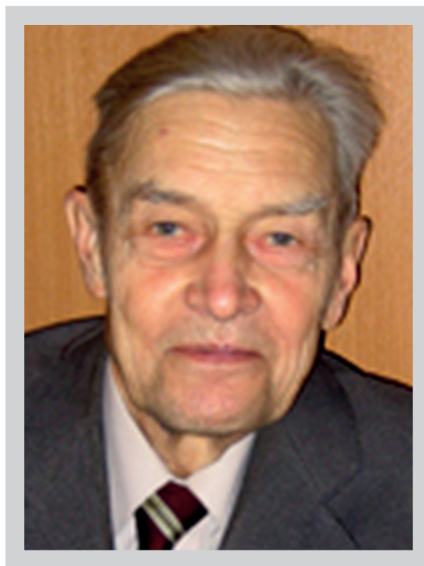
Фото 4. Профессор В.П. Бранский

Отстаивая тезис о том, что учение о ценности, или аксиология, является высшим «этажом» философского здания, В.П. Бранский пришёл к выводу, что понятия «идеал» и «истина» существенно связаны друг с другом. Истина как соответствие знания объекту, каким он существует до, вне и независимо от человека, доказывается тем, что имеется «возможность появления в нашем сознании мысли о существовании независимой от знания реальности» [13, с. 521]. Что касается идеала, то «он даёт нам картину мира не таким, каков он есть, а таким, каким он должен быть согласно нашему желанию» [13, с. 522]. Диалектика сущего и должного раскрывается В.П. Бранским как указание на то, что идеал — это не заблуждение и не ложь, а важнейший момент познания: «Если заблуждение есть отклонение знания от истины вопреки желанию, то идеал является таким от-