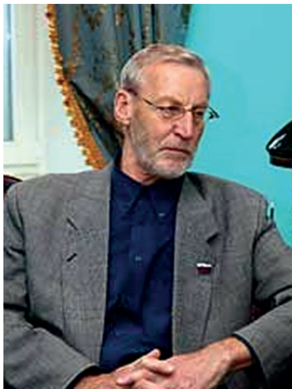
Фото 6. Профессор Ю.Н. Солонин, декан философского факультета СПбГУ (1989–2010)

Немаловажную роль в развитии новых тенденций постсоветской философии сыграл и организованный Ю.Н. Солониным междисциплинарный Центр изучения консерватизма. Задачей Центра являлось всестороннее и конкретное изучение методологических и историко-философских аспектов консерватизма с целью обоснования его актуальности для постсоветской России. Согласно Ю.Н. Солонину, консерватизм сам по себе является творческой