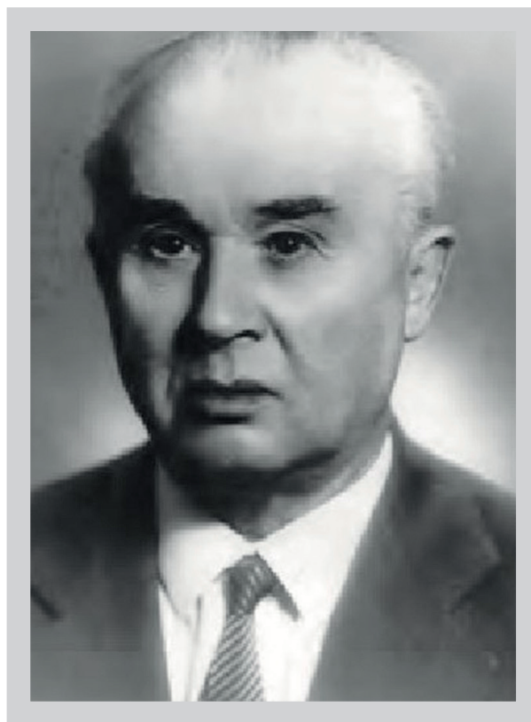
Фото 2. Профессор В.П. Тугаринов, декан философского факультета ЛГУ (1951–1960)

Размышления о смысле жизни человека закономерно приводили В.П. Тугарино-