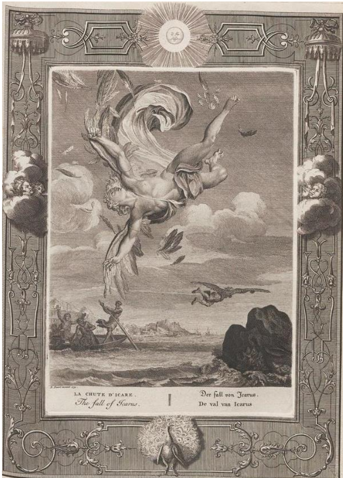
Рис. 1. Б. Пикар. Падение Икара. По мотивам А. ван Дипенбека.

Иллюстрация из сборника «Храм Муз», Амстердам, 1733 г.