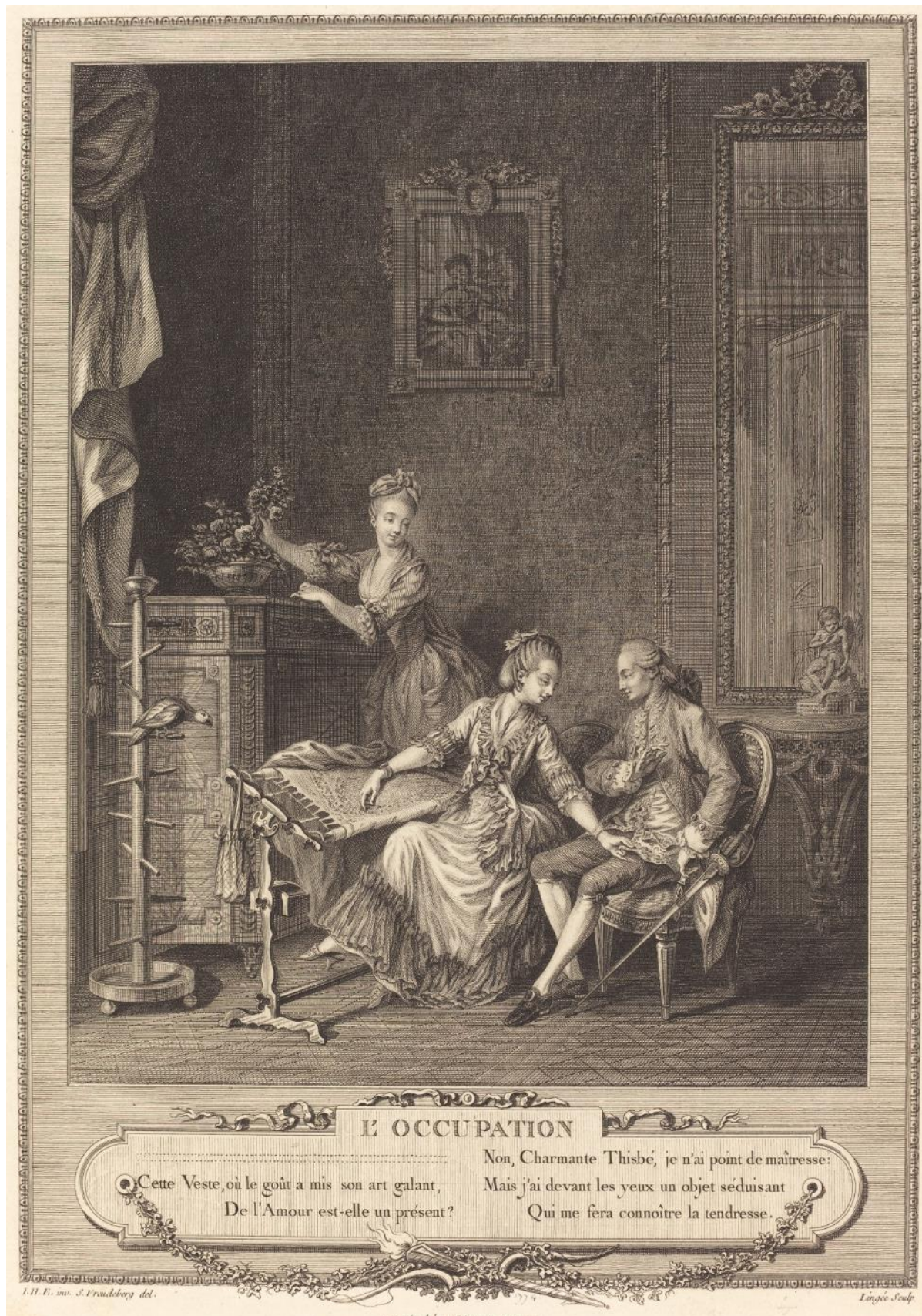
Рис. 2. Ш. Л. Линжи. По рисунку З. Фрейденбергера. Занятие. 1775 г. Fig. 2. Charles Louis Lingée inspired by Sigmund Freudenberger. "The Occupation", 1775