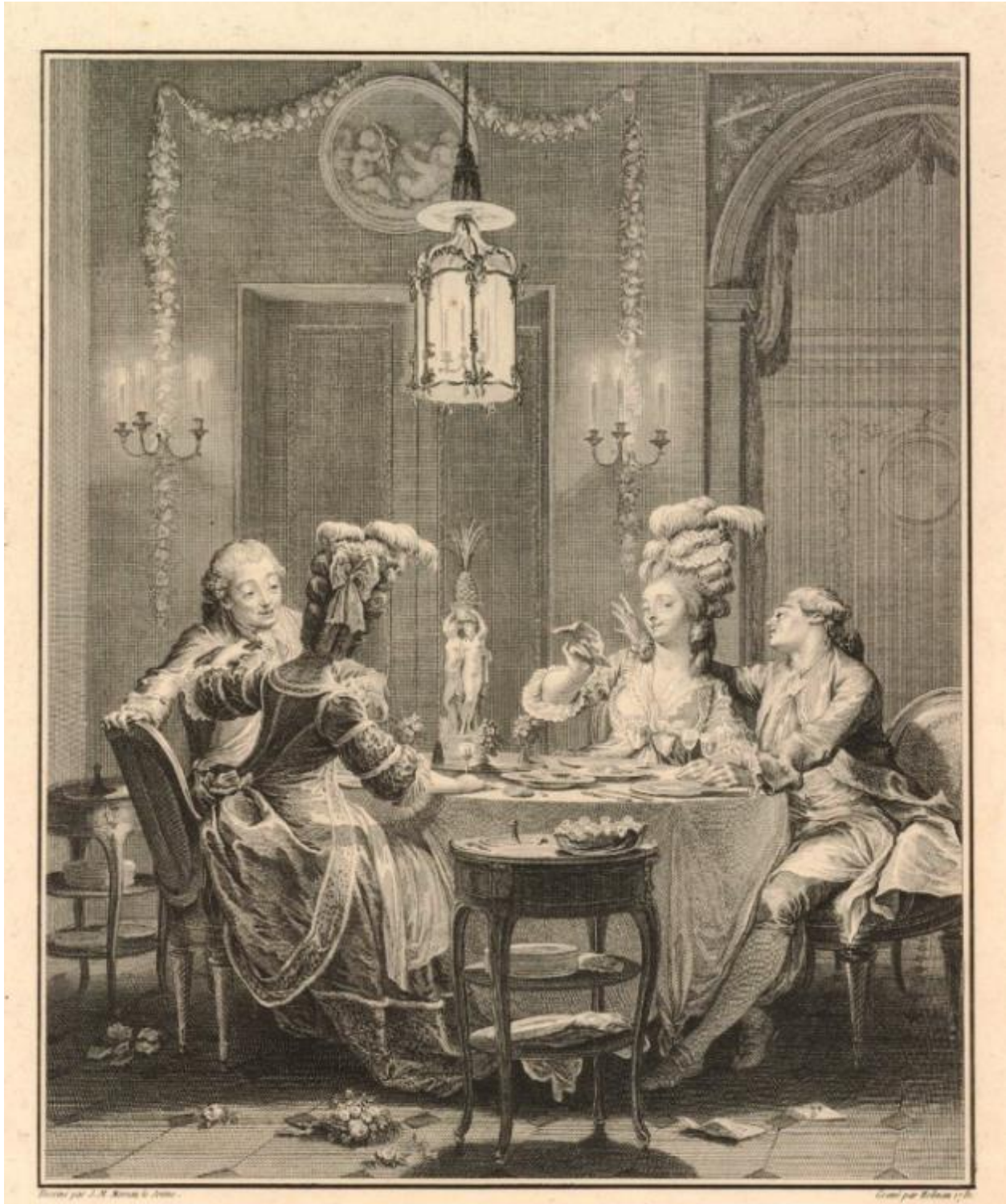
Рис. 4. Э. И. Станислас. По рисунку Ж.-М. Моро-Младшего. Изысканный ужин. 1781 г. Fig. 4. Isidor Stanislas inspired by Jean-Michel Moreau the Younger. "Elegant Dinner", 1781