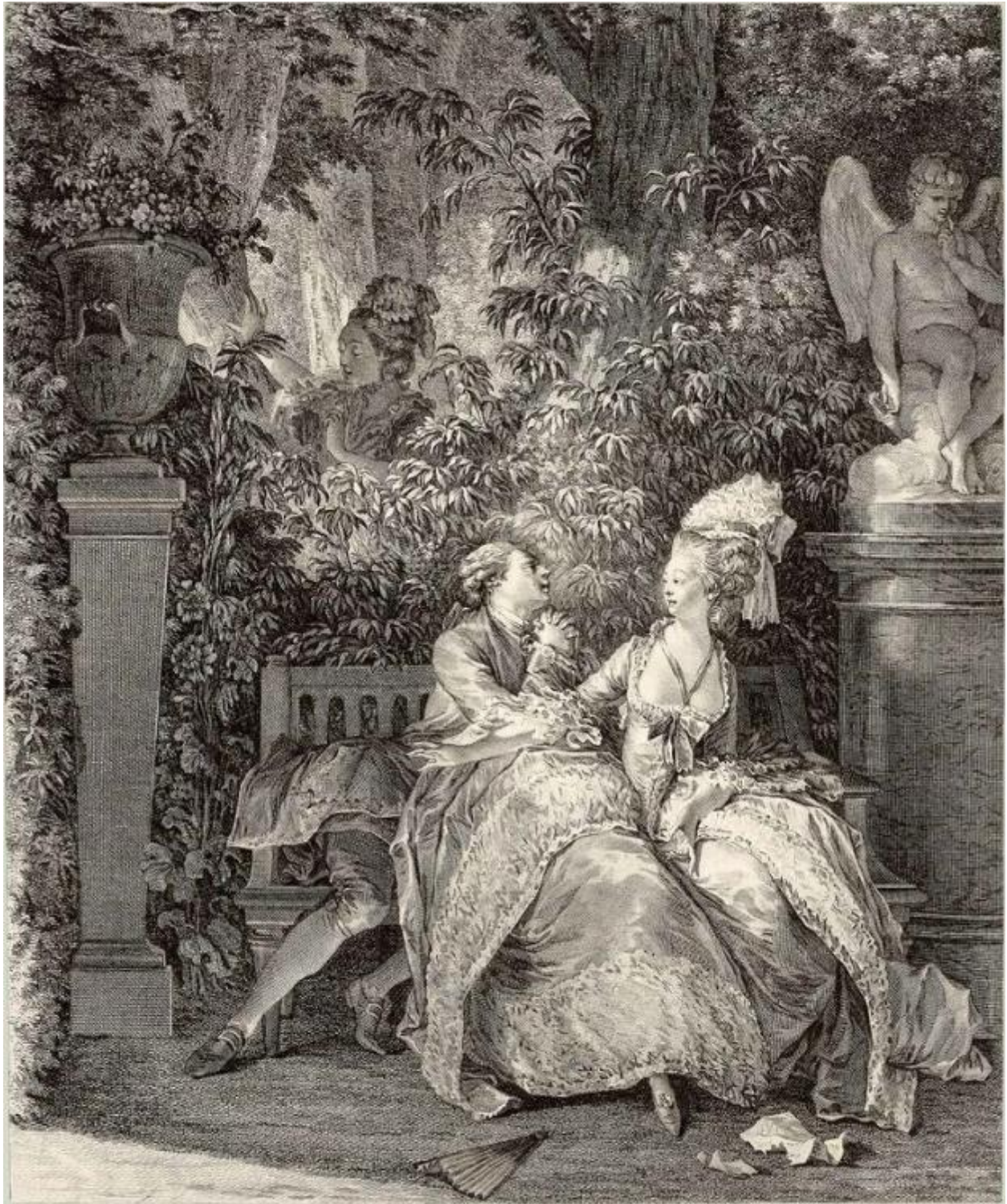
Рис. 3. Н. Тома. По рисунку Ж.-М. Моро-Младшего. Да или нет. 1781 г. Fig. 3. N. Thomas inspired by Jean-Michel Moreau the Younger. "Yes or No", 1781