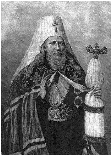
Митрополит Кишиневский и Хотинский Гавриил (Бәнулеску-Бодони)