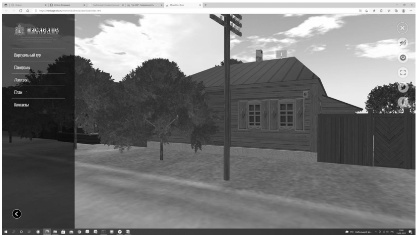
Рис. 3. Визуализация начальной страницы виртуального тура

бора на площади Кронштадтской – https://heritage.tstu.ru/memorial/directaccess/luka/index.htm , визуализация начальной страницы представлена на рис. 3.