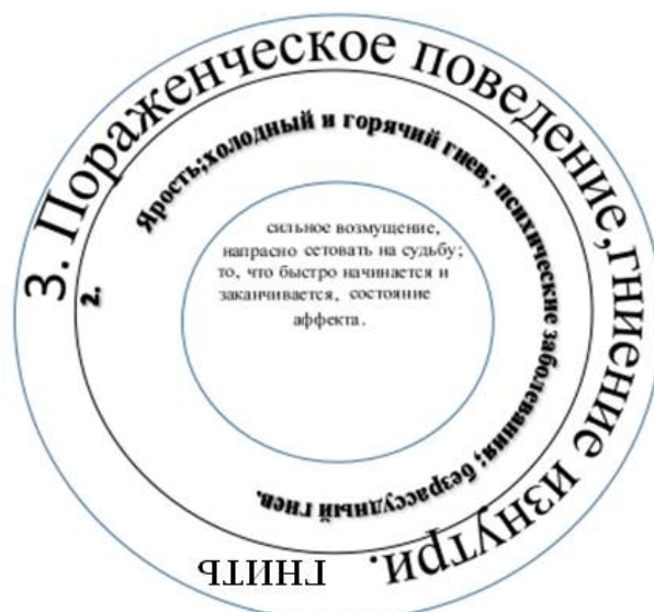
Рис. 1. Репрезентация концепта «гнев» в русском языке

Гнев – отрицательная базовая эмоция, воспроизводящая неприятное экспериментальное знание. Эмоциональное переживание ценно тем, что наделено когницией, мотивировано убеждениями индивида, отражающими его нравственность [5: 76]: Следовательно, субъективное оценочное отношение антропоцентрично, лингвокультурно и когнитивно. Механизм вербализации художественного образа способствует лучшей экспликации авторской мысли, а гендерный аспект создает натуралистичность, воплощающую содержательную форму: изображенный мир и мир самого изображения, действительность автора и действительность героя. При этом необходимо отметить, что гендер – это совокупность черт, относящихся к маскулинности и феминности [22]. Как правило, под такими чертами подразумевается социальная роль или гендерная идентичность. Так, понятие «гендер» выступает дополняющим синонимом лексемы «пол» и в то же время противопоставляется ему. Гендер – абстрактная грамматическая категория, заключающаяся в социальном статусе, и тем самым дефинирует социокультурную причину половых различий; устанавливается посредством традиций, воспитания, нравственных и правовых норм. Биологический же пол дан человеку природой [4: 25]. Материалом обозначения гендерной идентичности является «мужской» и «женский» языки как производные общего языка, средство декодирования эмотивного состава – рассказ А.П. Чехова «Ведьма».