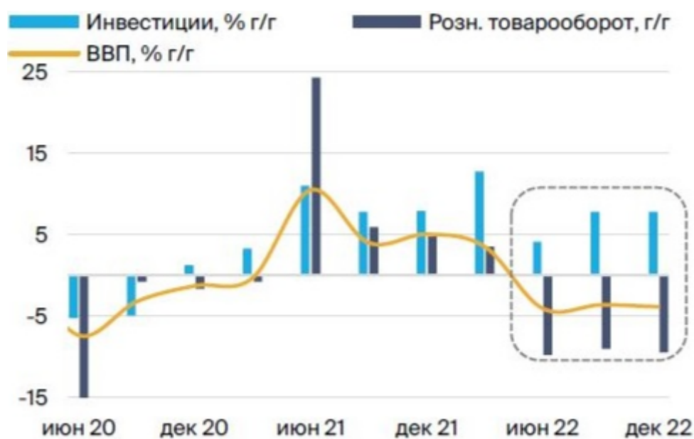
Рисунок 1 – Динамика потребления, инвестиций и ВВП [4]

Для развития финансового рынка России ЦБ разработал политику, рассчитанную до 2025 года, ее цели следующие: