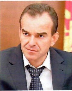
Вениамин Кондратьев, Губернатор Краснодарского края:

«В крае более 6 тысяч органов ТОС, это одно из самых больших по количественному показателю движений в стране. Они реализуют те задачи, которые на уровне главы поселения или МО могут быть не видны. Я понимаю, что для этого нужны средства. Поэтому мы приняли решение увеличить грантовую поддержку и выделить по программе «Народный бюджет» на пять лет 1,2 млрд рублей. Деньги пойдут на озеленение, создание зон отдыха, детских игровых площадок, ремонт уличного освещения».