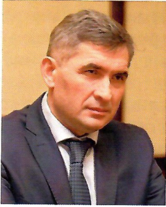
Олег Николаев, Глава Республики Чувашия:

«ТОСы являются незаменимым инструментом доведения до каждого жителя, до каждого населенного пункта мероприятий и задач в рамках посылов Президента России. Если эта работа будет организована системно, если ТОСы будут функционировать повсеместно и будет налажена коммуникация, организован обмен практиками, которые дают хороший результат, мы будем получать объективную информацию о состоянии дел в каждом населенном пункте и иметь возможность принимать эффективные, своевременные решения. Это будет результат работы многотысячного коллектива людей, которые занимаются развитием ТОС».