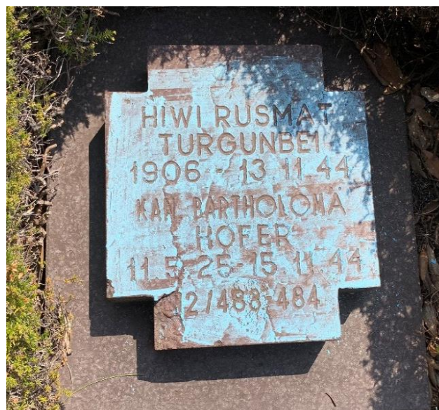
Рис. 4. Захоронение Русмата Тургунбая на кладбище Костермано

На этом кладбище были обнаружены три захоронения среднеазиатцев: Матшидова Абдуллина, Русмата Тургунбая и Масалежарова (?) – сейчас проходит их идентификация (рис. 4).