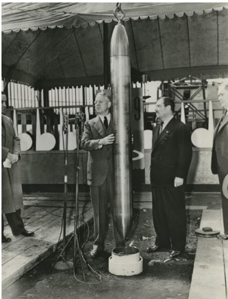
Рис. 1. Капсула времени компании Westinghouse перед закладкой. 1938 г. [14]

Вестингхаусская капсула представляется ярким примером модернистской технологии. Это объект, созданный на основе научных расчетов и позволяющий преодолеть природные ограничения материи. Кроме того, она эстетична: ее гладкая форма напоминает блестящий корпус ракеты (рис. 1). Как пишут Джон Бек и Марк Дорриан, это эмблематически современный объект [12. Р. 101].