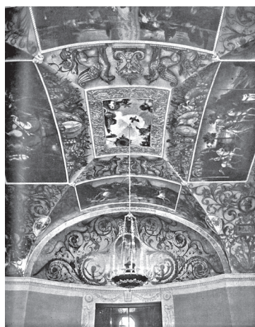
Рис. 8. Плафон вестибюля дома Скакового общества Арх. И.В. Жолтовский, худ. И.И. Нивинский, 1904–1905. Фото 1900-х гг.