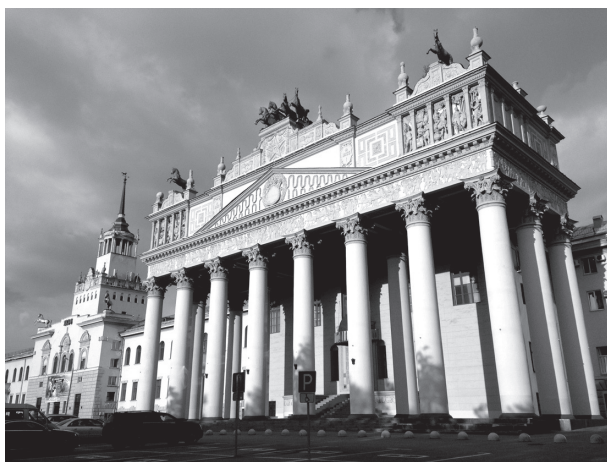
Рис. 4. Центральный московский ипподром Портик и башня. Фото 2018 г.