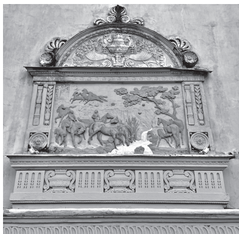
Рис. 6. Полихромный рельеф на главном фасаде здания Центрального московского ипподрома. Скульпт. В. Горчаков (?), 1950-е гг. Фото автора, 2022

Традиционная конная тяга неуклонно уступала московские улицы «лошадиным силам» автомобилей и автобусов. Культура обращения с лошастью превращалась в достояние немногих, последним ее оплотом оставалась сфера конного спорта. Для Жолтовского