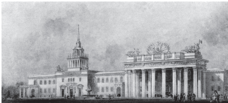
Рис. 3. И.В. Жолтовский и мастерская-школа Проект реконструкции московского ипподрома. Общий вид. Вариант. 1950.