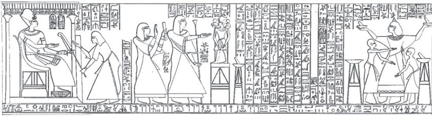
Рис. 2. Награждение Пенниута

гробница была перенесена из Анибы в Новую Амаду. Транспортировке подверглась только часовня, состоящая из комнаты с нишей, в которой находились три статуи. Большая часть изображений не сохранилась и известна нам по прорисовкам середины XIX в., сделанным художниками К.Р. Лепсиуса 7 .