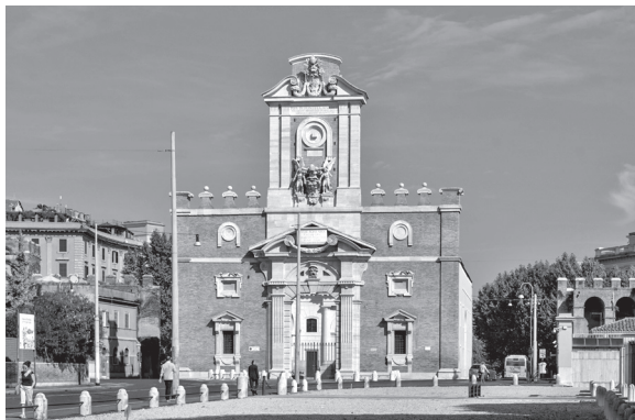
Рис. 5. Порта Пиа в Риме. Фасад Арх. Микеланджело Буонаротти, В. Веспиньяни, 1651–1565, 1869. Фото Dietmar Rabich, 2013 г. Источник: ©Wikimedia Commons