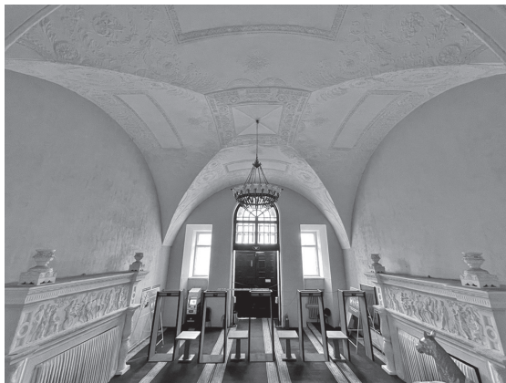
Рис. 7. Входной вестибюль Центрального московского ипподрома