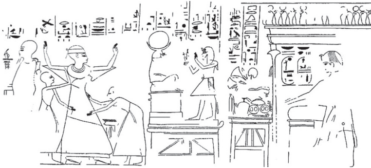
Рис. 1. Награждение из гробницы № 2 в некрополе Дейр Рифа

Скальная гробница чиновника Хнумаа (№ 2) некрополя Дейр Рифа датируется эпохой XII династии 1 . Пространства гробницы были вторично использованы неизвестным чиновником во времена фараона XX династии Рамсеса III (1183/1182–1152/1151 гг. до н. э.), о чем свидетельствуют сцены с изображением фараона и картушем Рамсеса III 2 .