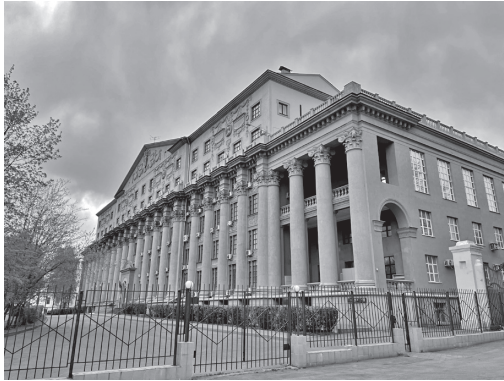
Рис. 9. Здание Института горного дела АН СССР (ныне ИМБ РАН) Арх. И.В. Жолтовский, Ю.Н. Шевердяев, К.И. Соломонов, Ш.А. Айрапетов, 1951–1960. Общий вид.