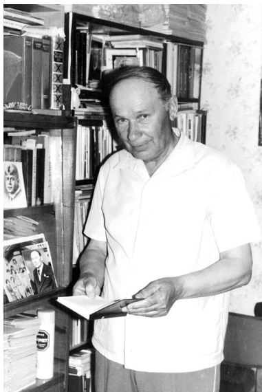
Дома за книгой