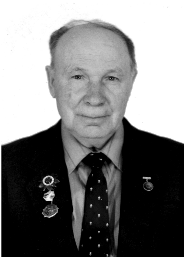
А.В. Громов (1922–2012)