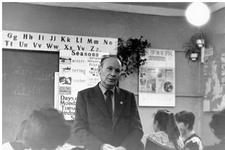
Классный час на тему «Слово народа, слово писателя, поэта». Мантуровская средняя школа № 1. 1987 г.

«Про любовь» и «Погрустим» – самые большие разделы. Их содержимое не стоит дополнительно комментировать. Только хочется ещё раз подчеркнуть, что даже печальные частушки наполнены юмором и оптимизмом. Смеяться до слез, петь, когда тебе грустно, плакать от счастья, укачивать детей частушкой – это по-нашему.