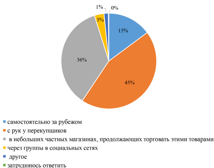
Рис. 2. Способы приобретения «санкционных» товаров жителями Калининградской области

Устойчивость потребительских предпочтений, отмеченная выше, связана с рядом причин. Среди главных респонденты называют качество импортной продукции и собственные вкусовые предпочтения. На третьем месте — отсутствие на местном рынке подобной продукции. Лишь четвертое место среди причин таких покупок занимает более низкая цена. При этом людям с разным уровнем доходов, очевидно, присущи разные причины покупки «санкционных» товаров — жители в плохом и очень плохом материальном положении гораздо чаще выбирали покупку «санкционных товаров» по причине низкой стоимости (18 против 13 % по выборке), а для калининградцев, охарактеризовавших свое материальное положение как хорошее или очень хорошее, гораздо большую ценность представлял более широкий ассортимент «санкционной» продукции.