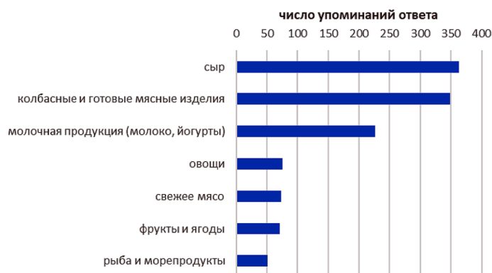
Рис. 3. «Санкционные» товары, которые жители Калининградской области продолжили покупать после 2014 г.

Около половины респондентов заметили увеличение объема и ассортимента продукции в магазинах, а также появление новых калининградских производителей. Чуть менее отчетливы изменения в отношении продовольствия из других регионов России и стран, не попавших под санкции. Четверть респондентов отметила увеличение представленности белорусской продукции в торговых точках. Многочисленна также группа опрошенных, обративших внимание на рост числа продовольственных товаров из Казахстана. Правда стоит отметить, что это прежде всего кондитерская продукция, которая под продовольственное эмбарго не попала.