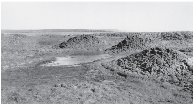
Рис. 4. Термокарстовый комплекс.