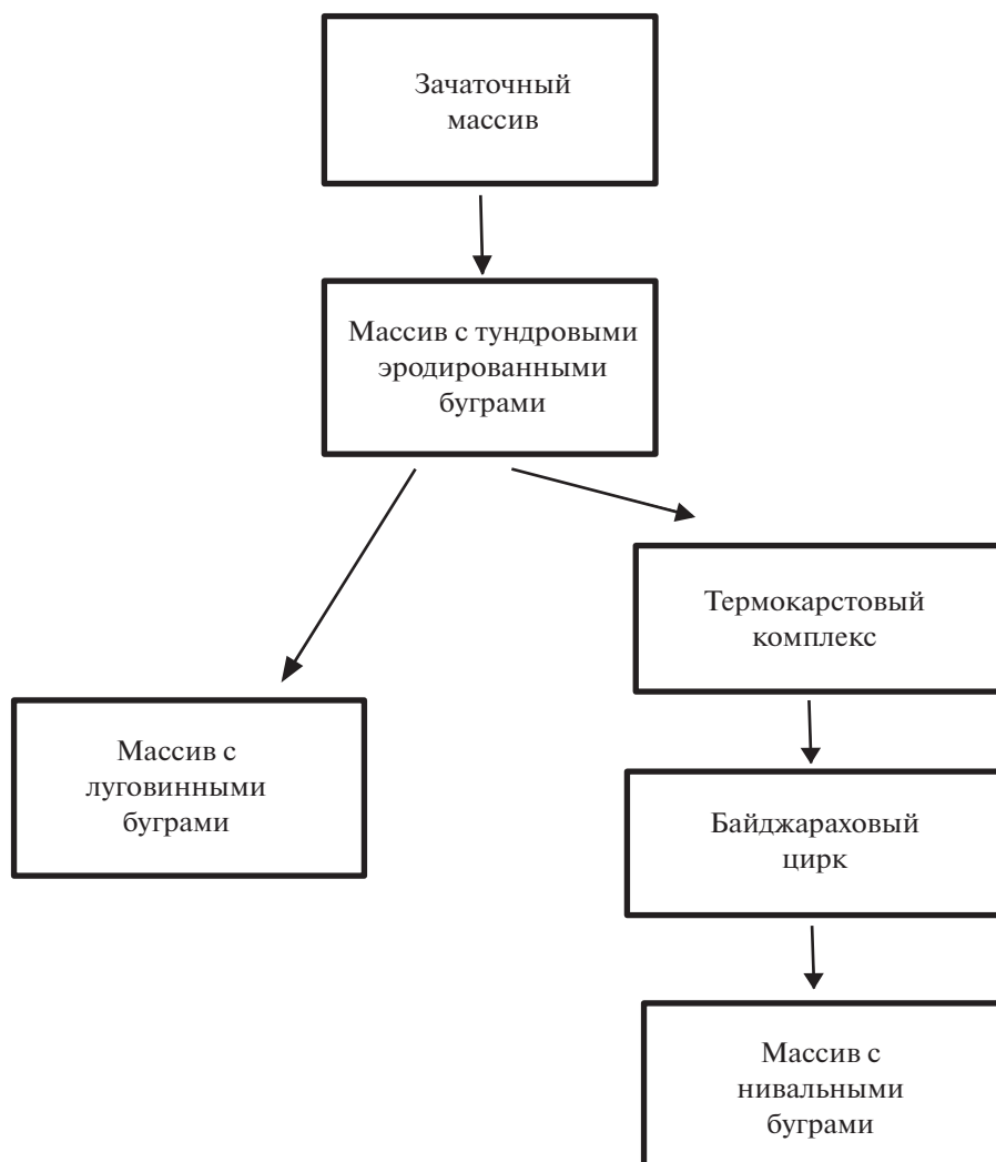
Рис. 6. Этапы развития массива байджарахов. Fig. 6. Stages of baidzharakh massif development.

ставлены 2–4 типами (обычны луговинный и тундровый лишайниковый), ложбин – также 2–4 (преимущественно ожиковый тундровый, лисохвостовый и кисличниковый типы). На бугры высотой до 1.2 м и диаметром 4–7 м приходится 30–45% площади. Элементарные массивы располагаются довольно четкими полосами поперек склона (образуют поясной ряд комплексов), реже – нерегулярно (совокупность комплексов). Данный тип массивов в районе исследований встречается нечасто.