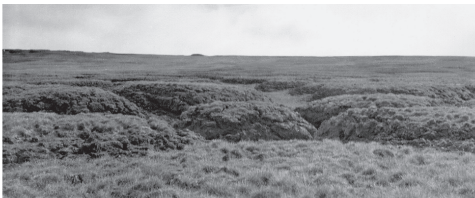
Рис. 2. Плоскобугристый торфяник, о. Котельный, 1974 г. Fig. 2. Flat-mound peatland, Kotelny Island, 1974.

Характеризуя растительный покров массива, в качестве основной единицы принимали растительные сообщества бугров и ложбин. Для первых геоботанические описания делали в их границах, для вторых – на прямоугольных площадках около 30 м 2 , что совпадало со средней площадью бугров. В описании отмечали: положение бугра (или ложбины) в пределах массива, увлажнение, особенности нанорельефа, процент пятен грунта или иных эродированных участков и степень их зарастания, физиономические черты сообщества, общее проективное покрытие, проективное покрытие сосудистых растений, мхов и лишайников, проективное покрытие каждого вида.