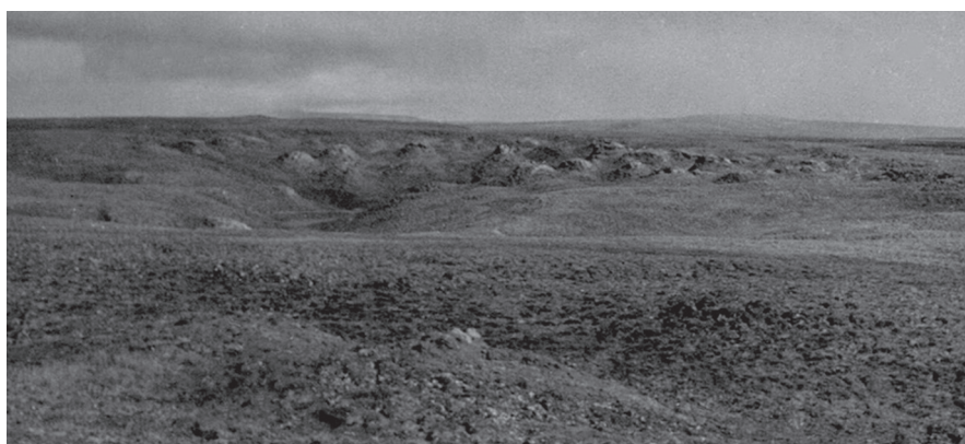
Рис. 5. Байджараховый цирк.