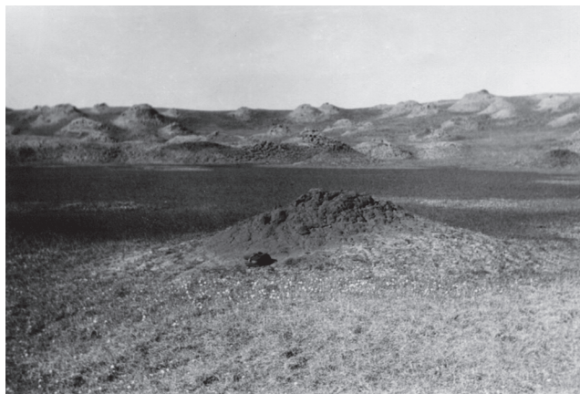
Рис. 1. Байджарахи, о. Котельный, 1974 г.