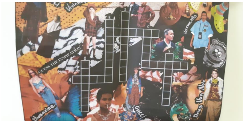
Рис. 4. Crossword 1

Студенты также подготовили увлекательные плакаты-ребусы и плакаты-кроссворды: