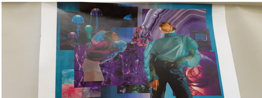
Рис. 3. Clothes design

Вот еще замечательный плакат, предложенный студентами группы: