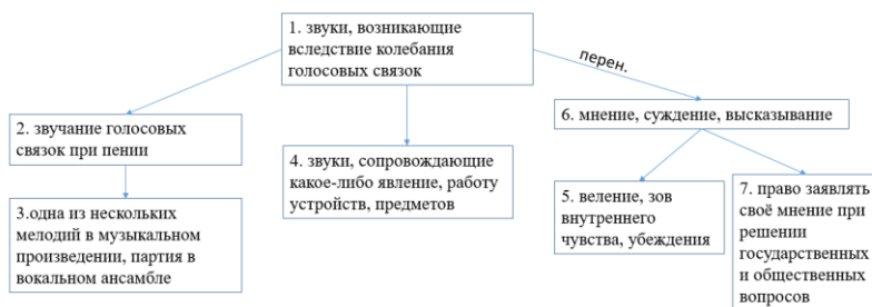
Схема 1. Радиально-цепочечная полисемия на примере многозначной лексемы «голос».

В монографии Ю. Д. Апресяна представлено членение многозначности с учётом отношений мотивированности между значениями (данное членение считается общепризнанным). Выделяются следующие разновидности многозначности: цепочечная, радиальная и радиально-цепочечная. При цепочечной многозначности компоненты семантической структуры слова представлены как последовательно скреплённые звенья (т. е. каждое новое значение слова мотивировано ближайшим к нему значением), которые пересекаются содержательно. Следовательно, крайние «звенья» могут вообще не обладать общими семами, так как мотивация последовательна. Усвоение значений лексемы, которые на первый взгляд не связаны между собой, может оказаться наиболее сложным для усвоения студентами, изучающими русский язык, однако учёт данной разновидности полисемии способствует созданию прочных ассоциативных связей между значениями в процессе изучения лексики. Радиальная полисемия предполагает наличие ядерного значения, с которым связаны остальные значения слова. Однако не всегда предполагается наличие какого-либо общего компонента, но значения должны находиться в отношениях параллельного включения. Наиболее сложной (но и наиболее частой) разновидностью полисемии представлена радиально-цепочечная, что предполагает наличие связанных значений слова как цепочечно, так и связанных с помощью наличия ядерного значения (схема 1)