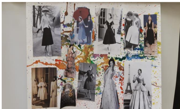
Рис. 6. Yves Saint Laurent

Ниже представлен еще один красочный плакат. Он посвящен творчеству известного дизайнера Ив Сент Лорана: