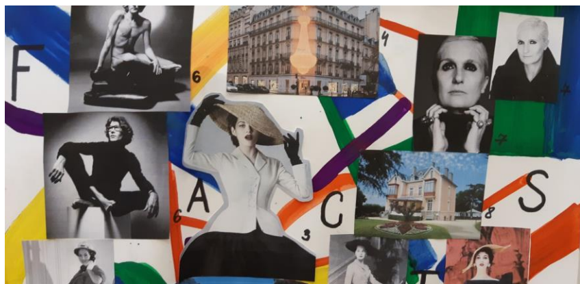
Рис. 5. Crossword 2

Работа с кроссвордами показалась студентам очень интересной. Они с удовольствием угадывали и вписывали слова, тем самым пополняя свой словарный запас по английскому языку и совершенствуя англоязычные навыки. По их словам, им нравятся задания-задачи, требующие размышления и поиска решения. Именно кроссворды дают им возможность работать в данном направлении, оттачивая свои языковые навыки и умения.