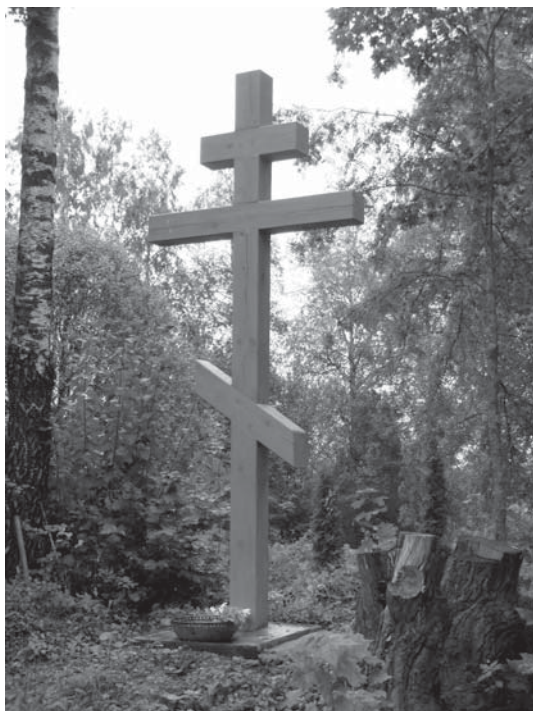
Поклонный крест на развалинах каменной Георгиевской церкви погоста Зряковичи (ныне д. Зряковская Гора)

на остатках фундамента каменной Георгиевской церкви был водружен деревянный поклонный крест.