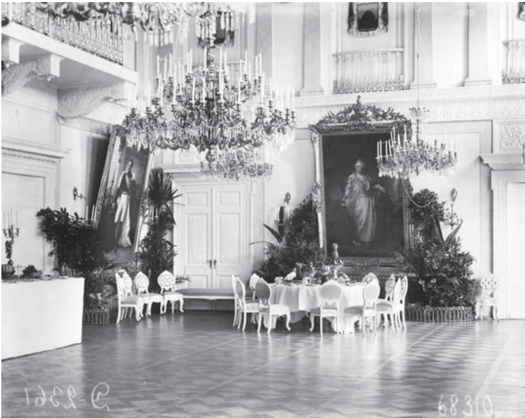
Зал Псковского дворянского собрания, подготовленный к приему Императора Николая II 9 августа 1903 г.

Последней железнодорожной станцией перед Псковом, а, стало быть, перед отречением, которую Николай II проехал без остановки вечером 1 марта 1917 г. будучи еще Императором, была станция Карамышево... 8