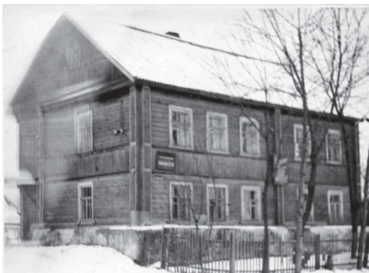
Здание карамышевской библиотеки, построенное в 1944 г.

В октябре 1974 года детская Карамышевская библиотека получила статус Центральной районной детской библиотеки (ЦРДБ) Псковского района. В ней функционировали: читальный зал, абонемент, методический центр и музей «Русская изба», который, выражаясь современными терминами, можно обозначить как интерактивный учебный класс по истории русского деревенского быта.