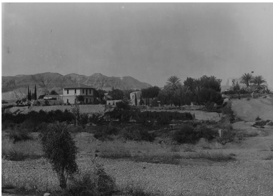
Ил. 6. «Миссийский сад в Иерихоне» (л. 20)

После елеонских русских построек закономерно включение в альбом фотографии (ил. 5), посвященной Вифании — селению на юго-восточном склоне Елеонской горы, через которое по Иерихонской дороге проходил в Иерусалим Иисус Христос с учениками, здесь же находилась гробница праведного Лазаря. Напротив монастыря Встречи, воздвигнутого в память о встрече сестер Лазаря Марфы и Марии со Спасителем, располагался русский участок, приобретенный архим. Леонидом (Сенцовым) в 1909 г. (подробнее об этом см.: [Лисовой 2004, с. 589]). Этим, очевидно, и мотивировано включение в альбом фотографии «Домик в Вифании на Миссийском участке» (л. 17).