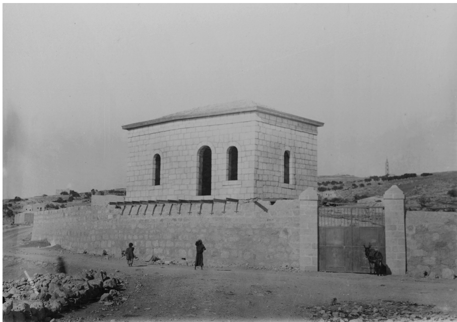
Ил. 5. «Домик в Вифании на Миссийском участке» (л. 17)