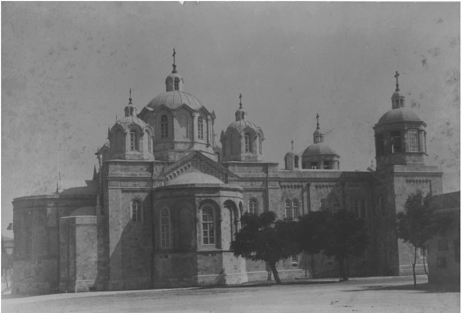
Ил. 2. «Св. Троицкий собор» (л. 1)

назвал проведение ремонта в здании Миссии и роспись церкви св. царицы Александры [Леонид (Сенцов), с. 308].