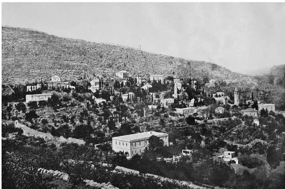
Ил. 10. «Общий вид русской Горненской женской общины во граде Иудове» (иллюстрация к очерку А. А. Дмитриевского «Горненская русская женская община во граде Иудове (близ Иерусалима)»)

А фотография из альбома « Горненская Русская женская община » (л. 6) иллюстрирует очерк «Горненская русская женская община во граде Иудове (близ Иерусалима)» [Дмитриевский 1916, с. 2–3, вклейка]