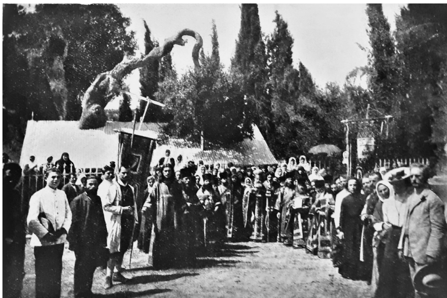
Ил. 9. «Крестный ход у дуба Мамврийского на третий день Троицы, по окончании литургии» (иллюстрация к очерку А. А. Дмитриевского «Праздник Св. Троицы на Сионской горе и у дуба Мамврийского в Хевроне»)

Можно предположить, что преподнесенный архим. Леонидом подарок не оставил Дмитриевского равнодушным: некоторые фотографии из альбома аналогичны фотографиям, которыми проиллюстрированы его воспоминания, изданные после возвращения секретаря Палестинского общества из поездки. Так, в брошюре «Праздник Святой Троицы на Сионской горе и у дуба Мамврийского в Хевроне» воспроизведена фотография с изображением крестного хода у дуба Мамврийского, аналогичная снимку на л. 25 альбома архим. Леонида, в центре которой запечатлен и он [Дмитриевский 1913b, с. 38—39, вклейка] (см. ил. 9).