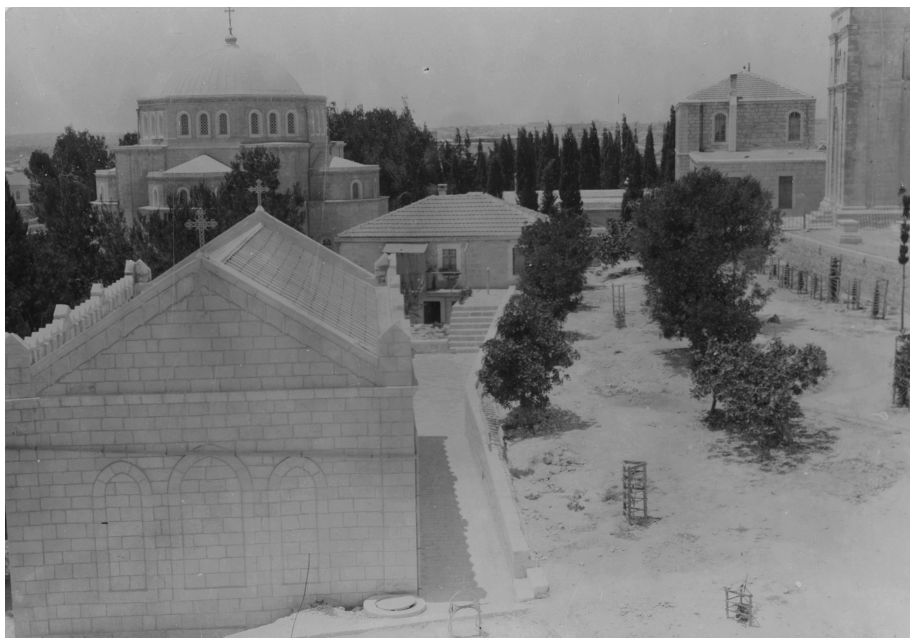
Илл. 4. «Елеонская Русская женская община» (л. 15)

Формирование «русского Елеона» положено архим. Антонином (Капустиным) в 1869–1871 гг. приобретением земельных участков на вершине горы, где находилась церковь Вознесения. Во время работ по обустройству территории было найдено немало артефактов, которые и составили экспонаты организованного здесь начальником Миссии музея. Спасо-Вознесенский храм Миссии на Елеонской горе был освящен 8 июня 1886 г. Кроме него, архим. Антонин (Капустин) инициировал и осуществил постройку колокольни — самого высокого здания Иерусалима 24 , известного под названием «Русская свеча» [Лисовой 2008, с. 320–321] 25 . С конца XIX в. описание русского Спасо-Вознесенского храма как части русских построек на Елеоне находим и в записках паломников: «На этом месте построена