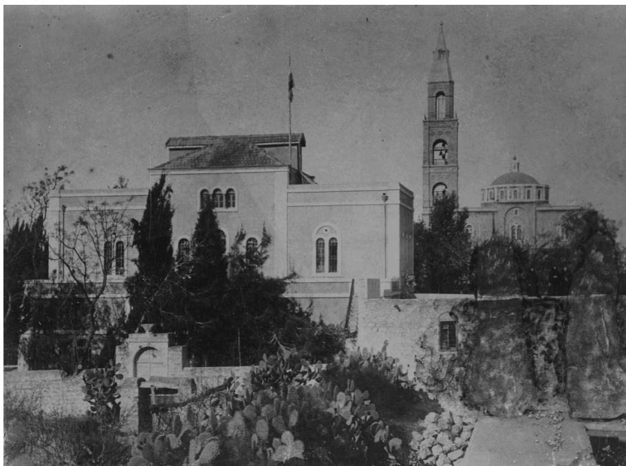
Ил. 7. «Яффский сад» (л. 27)

которыми системно занимались сотрудники Миссии с момента ее организации 30 . Историю русского присутствия в Яффе в альбоме архим. Леонида иллюстрируют пять фотографий: « Яффский сад Миссийский » (панорама, л. 26); « Яффский сад » (вид внутри, л. 27); « Русский храм в Яффе » (л. 28); « Пещера св. праведной Тавифы в Миссийском Яффском саду » (л. 29); « Св. изображение в Яффском храме » (л. 30).