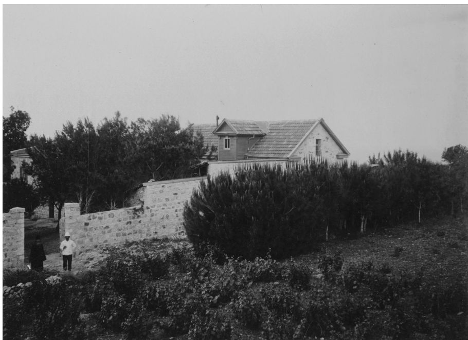
Ил. 8. «Миссийский участок на горе Кармил» (л. 33)

На берегу Тивериадского озера расположен и г. Магдала, известный по Евангелию от Матфея (Мф. 15: 39) как место, освященное присутствием Спасителя, а также как родина Марии Магдалины. Закономерно присутствие в рассматриваемом альбоме фотографии с одноименным названием — « Магдала » (л. 32): к этой местности архим. Леонид (Сенцов) имел интерес, реализованный им в 1911 г., когда был приобретен так называемый Магдальский сад на берегу Генисаретского озера [Смирнова, Бутова, с. 530] и в нем планировалась постройка церкви равноапостольной Марии Магдалины, осуществленная только в 1962 г. [Лисовой, Смирнова, с. 484].