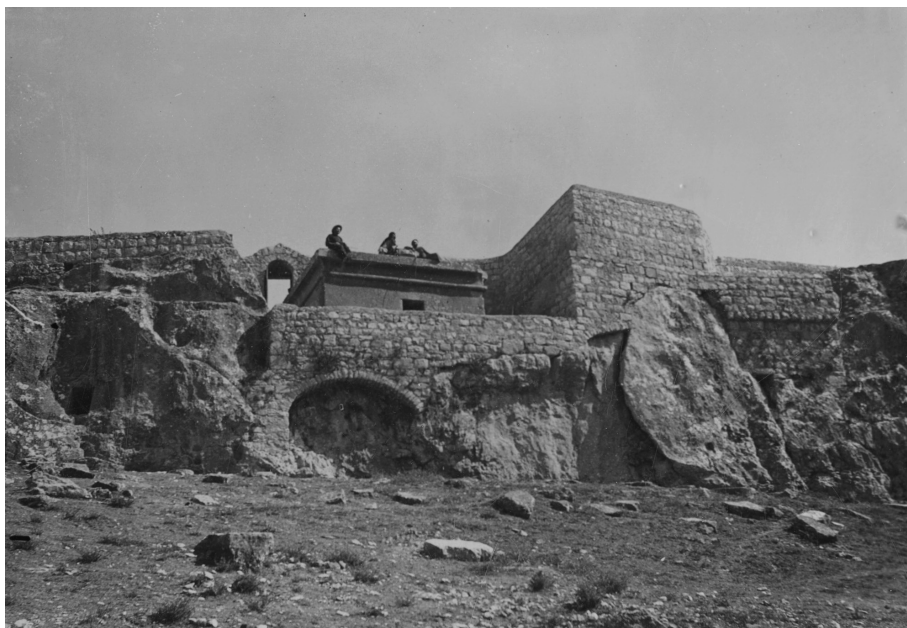
Ил. 3. «Силоам (2-й Миссийский участок)» (л. 13)

На следующих двух фотографиях: « Миссийский участок в Силоаме » (л. 12) и « Силоам (2-й Миссийский участок) » (л. 13) (см. ил. 3) — запечатлены два из 16 земельных участков, приобретенных Миссией при архим. Леониде (Сенцове). А фотографии на л. 14–16: « Елеонская Русская церковь », « Елеонская Русская женская община », « Музей на Елеонской горе » — посвящены русскому участку на Елеонской горе.