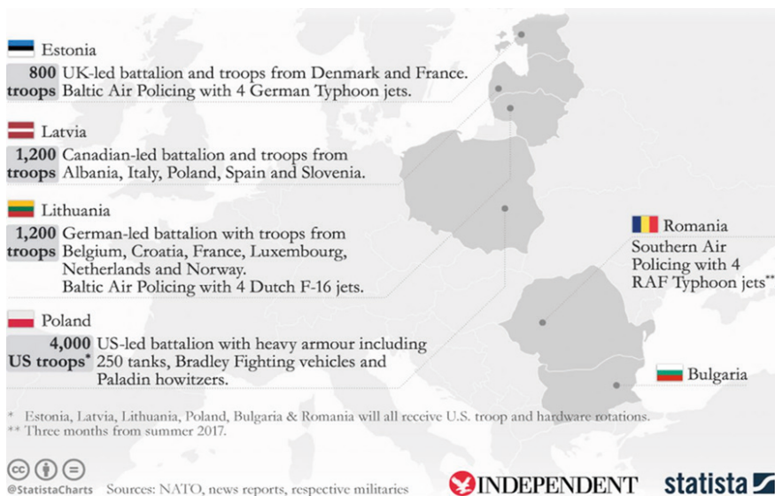
Figure 3. NATO’s military buildup in Eastern Europe