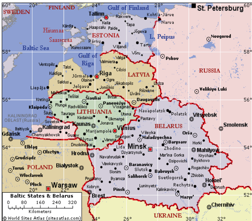
Figure 1. The Baltic States and Belarus

countries the Baltic States were facing socio-economic instability, formation of political parties, setting up a different and stable government model, democratization etc. The Baltic States followed the Western democracies path by setting up parliamentary form of government with unicameral parliaments elected for a four-year term. The Baltic States are small in size, their population is also low, so they can use only soft power tools to secure their independence. These states were trying to set up the democratic form of government by promoting the rule of law, democratic rights and freedom. Nation-building was the priority of these newly independent countries.