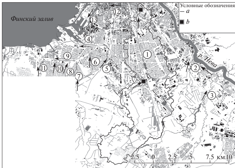
Рис. 1. Граница водосборного бассейна реки Волковки. 1 – р. Волковка; 2 – р. Мурзинка; 3 – р. Славянка; 4 – р. Красненская; 5 – Лиговский канал; 6 – р. Дачная; 7 – р. Новая; 8 – р. Дудергофка; 9 – Дудергофский канал; 10 – р. Ивановка; 11 – р. Сосновка; 12 – Обводный канал; 13 – р. Екатерингофка; a – граница водосборного бассейна р. Волковки; b – точки наблюдения за хим. составом р. Волковки ГУП Водоканал СПб. Fig. 1. Boundaries of the Volkovka River watershed. 1 –Volkovka Riv.; 2 –Murzinka Riv.; 3 –Slavyanka Riv.; 4 –Krasnenkaya Riv.; 5 – Ligovskiy Channel; 6 – Dachnaya Riv.; 7 – Novaya Riv.; 8 – Dudergofka Riv.; 9 – Dudergofskiy Channel; 10 – Ivanovka Riv.; 11 – Sosnovka Riv.; 12 – Obvodny Channel; 13 –Ekateringofka Riv.; a –boundaries of the Volkovka River watershed; b – observation points.

Поступление общего азота и фосфора с водосборов Ладожского озера, рек Невы, Луги, Нарвы и других водных объектов бассейна Балтийского моря рассчитано в Институте озераедения РАН с помощью модели формирования биогенной нагрузки ILLM [7, с. 917]. Нами рассчитаны модули стока общего азота и фосфора с водосборов ряда водных объектов бассейна Балтийского моря. Результаты представлены в табл. 3.