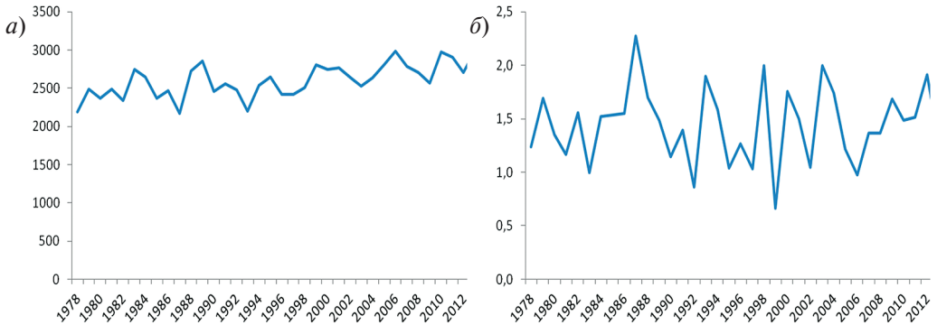
Рис. 1. Многолетний ход: а — сумма температур воздуха выше +5,0 °С за год (°С); б — гидротермического коэффициента (ГТК) в Санкт-Петербурге

осадков выше 5 мм в год; сумма осадков выше 10 мм в сезон) (рис. 1,а), либо характеризуется отсутствием направленных изменений (число дней с осадками выше 5 мм в сезон; сумма осадков выше 5 мм в сезон; число дней с осадками выше 10 мм в год; сумма осадков выше 10 мм в год; ГТК) (рис. 1,б). В то же время среднее многолетнее количество клещей испытывает тенденцию к понижению за последние 20 лет (рис. 2).