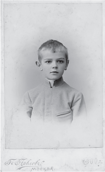
Рис. 4. Александр Зограф. Фото 1900 г.