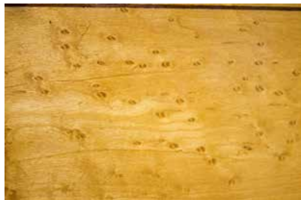
Ил. 1. Витрина Франция, 1-ая треть XIX в. (отделочный слой более позднего периода) Каркас – массив дуба, облицовка – шпон клёна «птичий глаз», стекло 79×47×43 см БСНН АСГ, инв. №13-0815