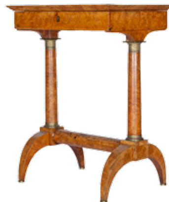
Ил. 6. Стол

Франция, 1-ая треть XIX в. (отделочный слой более позднего периода)