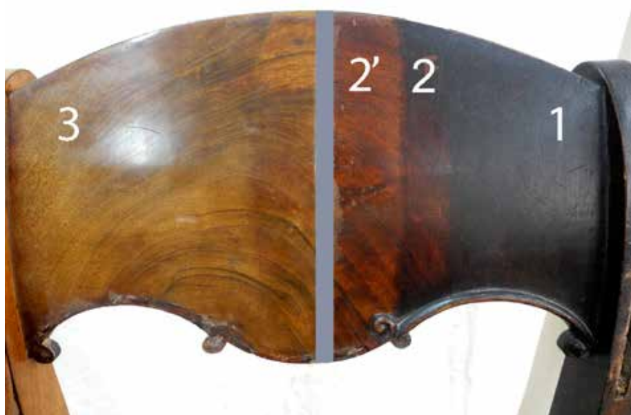
Ил. 5. Отделочный слой на спинке кресла. 1 – до реставрации, под слоем загрязнений, 2, 2' – частичная расчистка от загрязнений, 3 – полная расчистка отделочного слоя и последующая современная отделка шеллачным лаком без предварительной полировки маслом.

прочность и густой темный цвет от брусничного до вишневого оттенков. Воссозданная же реставраторами полировка дает светлый кирпично-красный цвет (ил. 5). Древесина предметов, облицованных светлыми породами дерева (березой, ясенем, тополем), вместо густого янтарного цвета с проявленной свилью приобретает ровный охристый цвет (ил. 6). Это происходит из-за неправильного понимания использованной технологии. В данной статье анализируются причины различий в цвете старой и восстановленной отделки.