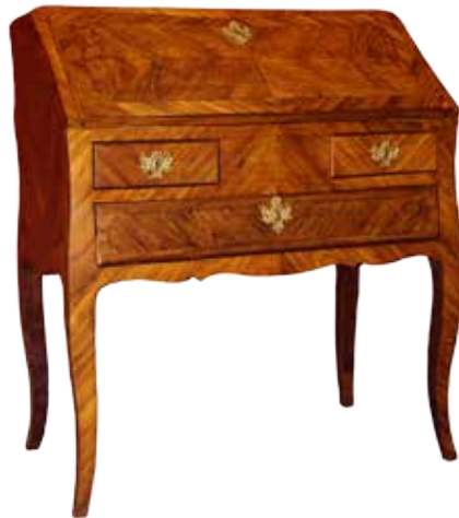
Ил. 8-9. В процессе реставрации КРИЭР, Матье (Criaerd, Mathieu)