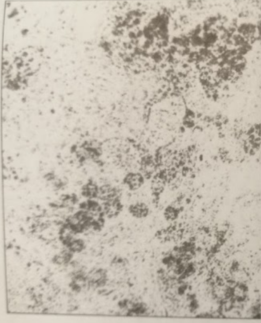
Рисунок 2 Печень крысы, погибшей после однократного введения смертельной дозы «Экстрасепт 1». Очаговая жировая дистрофия. Окраска Судан IV. Ув.40х7.

В то же время при вскрытии крыс, погибших после введения смертельных доз этилового спирта, отмечено только увеличение желудка, других