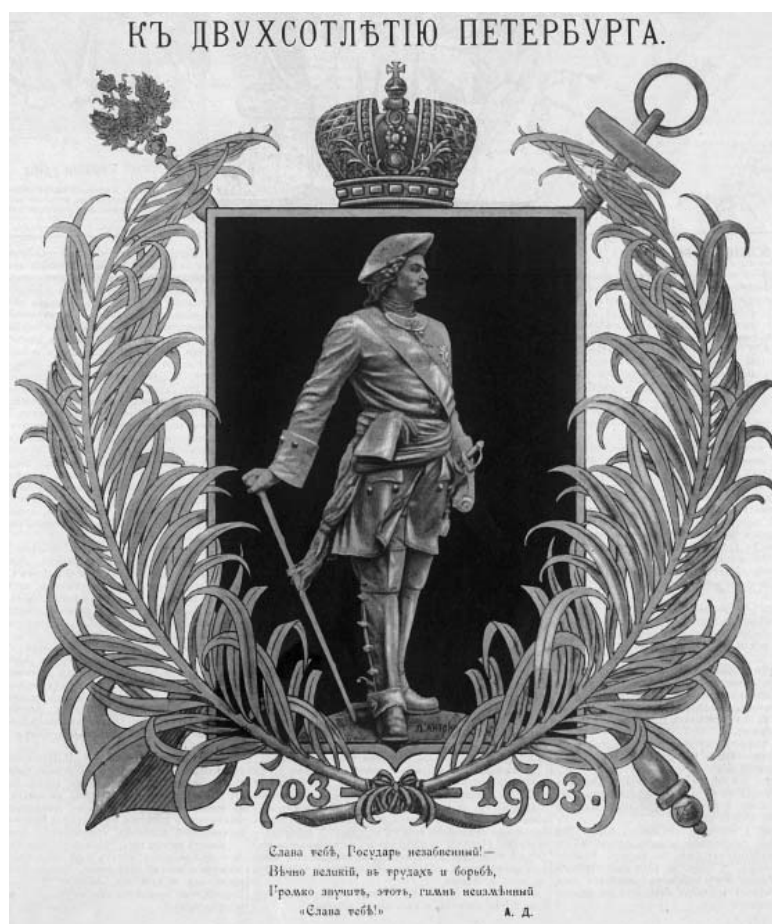
К 200-летию Петербурга. М.М. Антокольский. Стрекоза. 1903. № 20. 18 мая. С. 1 (Российская национальная библиотека)

Аллегорические иллюстрации, как правило, принадлежали кисти иностранных художников. Например, Х. Гейзер награвировал рисунок Б. Мюллера, где Медный всадник стоит в окружении бюста Екатерины Великой и аллегорических фигур, олицетворяющих Россию, Неву, Мудрость, Веру, Благополучие и пр. На щите у России – двуглавый орел, символ самодержавной власти. Художник либо не видел монумента, либо решил усилить аллегорию: Петр одет в рубаху навыпуск, узкие брюки, мягкие сапоги, подпоясан кушаком, на голове – лавровый венок [88, с. 487]. Визуальный образ Петра часто антиклизирован и/или увенчан ветвями лавра, чья символика славы хорошо прочитывалась многими читателями [133, вклейка; 34, с. 7]. Подобные аллегорические подходы объяснялись не только художественной традицией, но и тем, что в имперской России «привилегированные группы стремятся максимально дистанцироваться от низших классов. Они создают эту дистанцию, распространяя мифы – нарративы, инсценирующие их отличие от прочих смертных и сходство со святыми, героями или богами» [123, с. 20].