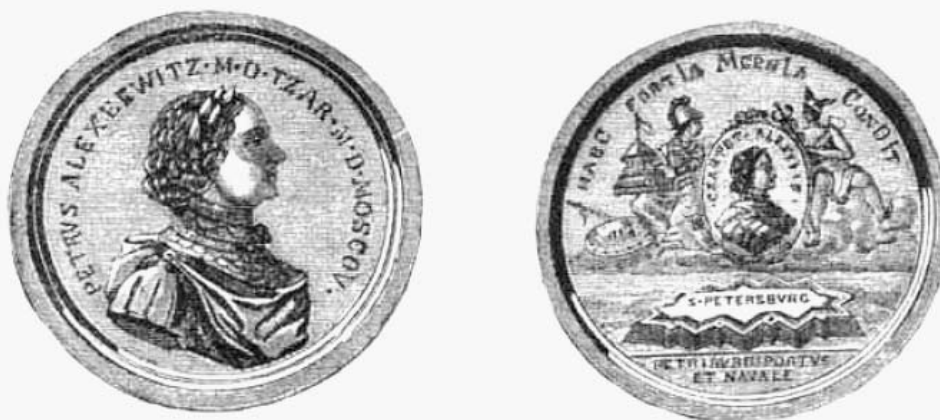
Медали на события 1703 года.

Новое время. Иллюстрированное приложение. 1903. № 9762. 10 мая. С. 9 (Российская национальная библиотека)