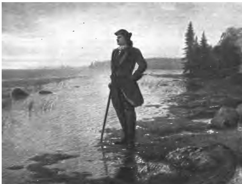
«На берегу пустынных волн». Л.Ф. Лагорио. Нива. 1909. № 34. 22 августа. С. 586 (Российская национальная библиотека)

Юбилейные обращения периодики к основанию Петербурга имели разнообразные визуальные формы. Это мог быть тематический подбор гравюр, доказывавших исконно русскую принадлежность земель в устье Невы, причем доказательства для подчеркивания исторической объективности брались из иностранных источников [104, с. 1; 103, с. 8]. Это могла быть жанровая картина, например, где меткий стрелок вручал царю подстреленного орла, по преданию кружившего тогда над местом закладки Петропавловской крепости. Сюжет с орлом как добрым предзнаменованием строительства новой столицы многократно варьировался в печати [19, с. 444; 96, ст. 723–724]. Часто встречались репродукции известных картин [128, вклейка; 48, с. 586], первые петербургские планы и карты [68, с. 7; 10, с. 138]; виды Петербурга в первой четверти XVIII века [78, с. 28] и пр.