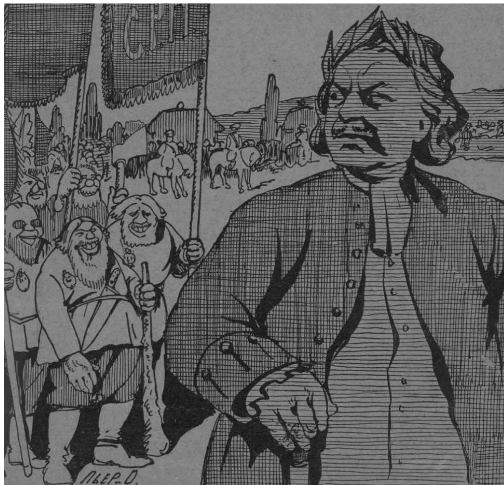
К Полтавским торжествам. С.В. Животовский. Огонек. 1909. № 26. 27 июня. С. 1

Основание города нередко подавалось в печати через сатирические обыгрывания фразы Фр. Альгаротти (метафоры, пущенной в русский обиход А.С. Пушкиным) про окно в Европу. Карикатуры напрямую визуализировали смысл крылатого выражения – так выглядит серия рисунков в «Будильнике», где антропоморфный Петербург беседует с Москвой у раскрытого окна либо перешагивает через кремлевскую стену, держа оконную раму [35, с. 1; 113, с. 1]. Иногда сатирическая графика, обыгрывая исторический контекст, демонстрировала закрывающееся окно в Европу – именно так было подано нежелание неких влиятельных сил разрешать социальные и бытовые проблемы и Петербурга, и всей России [92, с. 1; 97, с. 1; 98, с. 1]. Наконец, окно в Европу становилось образной точкой входа для внутренних имперских проблем, чем воспользовался, например, художник «Нового времени», намекая на стремление Финляндии к пассивному сопротивлению российской политике [58, с. 5].