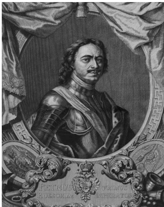
Император Петр Великий. А. Даугель (с оригинала К. Моора). Всемирная иллюстрация. 1872. № 178. 27 мая. С. 352 (Российская национальная библиотека)

Богоизбранность Петра и, соответственно, полную справедливость и законность его действий, помимо устоявшегося представления о помазаннике Божиим, художники подчеркивали с помощью аллегорий и символики. Как справедливо утверждает Е.А. Скворцова, «важнейшим средством прославления и легитимации современного правителя в государственной мифологии абсолютной монархии является обращение к античному и библейскому наследию, которое осмысливается аллегорически, сквозь призму представлений о вневременных добродетелях венценосца» [110]. Одно из наиболее ранних сохранившихся в печатной графике изображений Петра – конклюдия А.Ф. Зубова в «Книге Марсовой» 1713 года, «где изображение Петра трактуется как причастное к небесному: его голова нарисована на фоне облаков, на нее опущен луч божественного сияния, проходящий через лавровый венок славы, который несут два трубящих ангела, чтобы возложить его на голову Петра» [24, с. 60]. Аллегорические приемы были свойственны прежде всего парадным портретам [16, с. 352; 15, с. 1; 86, с. 8].