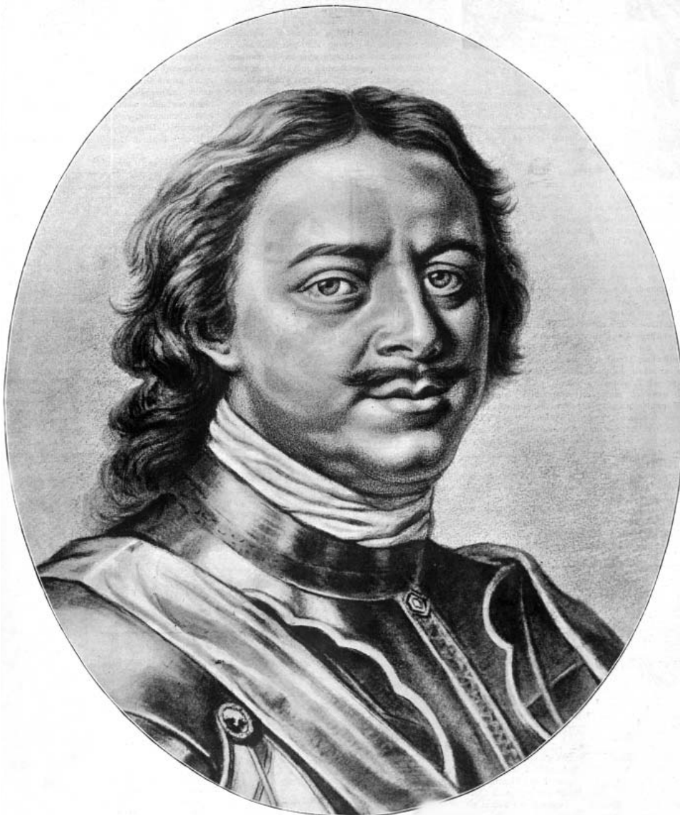
К 200-летию Петербурга. Петр Великий. Тип К. Моора – Я. Хоубракена. Искры. 1903. № 18. 11 мая. С. 137

Фиксация мест проживания великого императора тоже была значима. На газетно-журнальных полосах складывалось визуальное повествование о бытовой стороне жизни великого реформатора. Читатели из разных мест империи могли без помех разглядывать общие виды дворцов и домов, где Петр родился [2, с. 365], жил [20, с. 229] и скончался [28, вклейка], его жилье во время европейских путешествий [21, с. 861] и убежища, где он делил тяготы военных походов с соратниками [26, с. 397]. Отдельное место занимал домик Петра Великого в Петербурге – как сердце строящегося города [22, с. 1]. В умах читателя, ставшего к тому же зрителем, формировался устойчивый образ монарха, равнодушного к роскоши, но не пренебрегавшего ею ради государственного представительства.