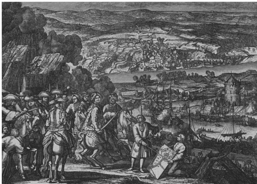
Взятие Азова Петром I, в 1696 году. А. Шхонебек, Ф. Паннемаркер. Живописное обозрение. 1882. Т. 1–2. № 44. 30 октября. С. 705 (Российская национальная библиотека)

Имперское мышление, внедренное в русское сознание с 1710-х годов после присоединения Эстляндии и Лифляндии, было выпестовано жаждой Петра I добиться выхода к морю. От возвращения отчей земли до завоевания новых бескрайних пространств, от готовности идти на любые уступки шведам за право выхода к Балтике до имперской неукротимости после Полтавской победы – вот схематичный путь, пройденный русской властью (осознанно) и русским народом (вынужденно) в первой четверти XVIII века. В последующие эпохи печать Российской империи освещала этот процесс в ракурсе героической необходимости. Газетно-журнальные полосы в дни юбилеев были переполнены репродукциями картин, посвященных сражению при Лесной [45, с. 413], взятию Азова [74, с. 705], Нарвы [44, с. 2–3], фотографиями к военным юбилеям [67, с. 318], изображением памятных медалей в честь взятия Ньюэнканса (Ниеншанца) и шведских фрегатов [54, с. 9] и пр.