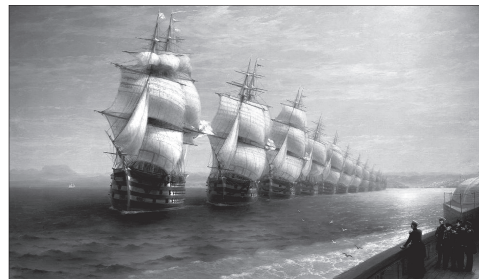
И. К. Айвазовский. Смотр Черноморского флота (не 1849, а 1852 г.). 1886 г. ЦГВММ