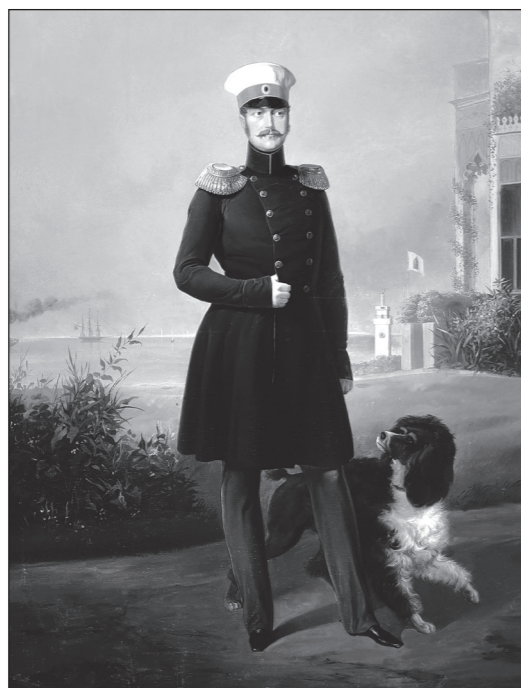
Е. И. Ботман. Портрет Николая I. 1849 г. Петергоф (Александрия). Коттедж