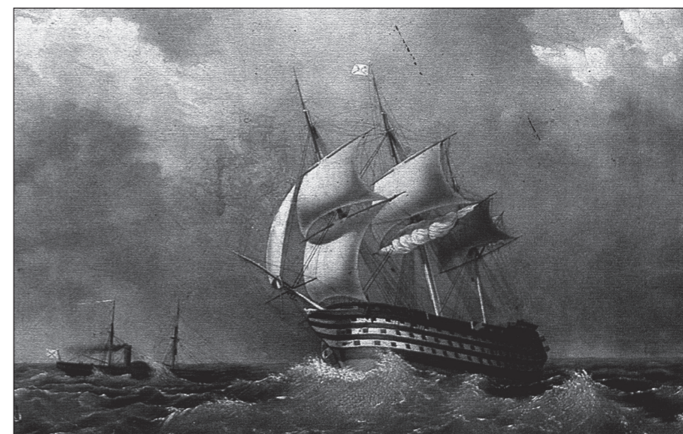
И. К. Айвазовский. 120-пушечный корабль «Париж»